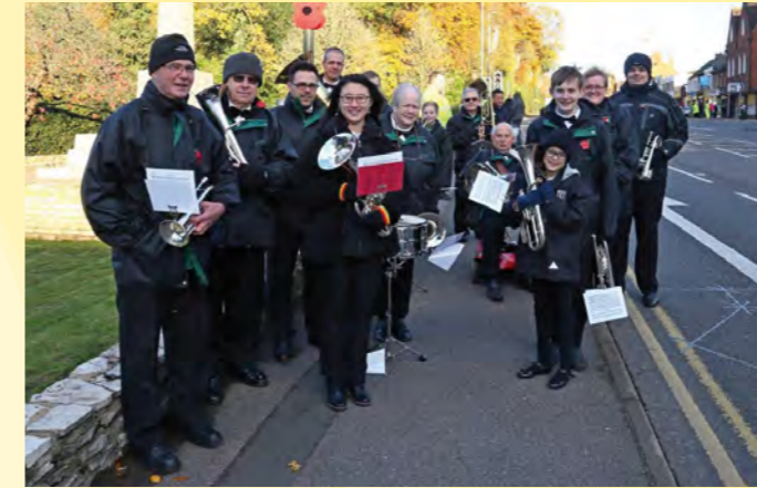
Die Camberley and District Silver Band