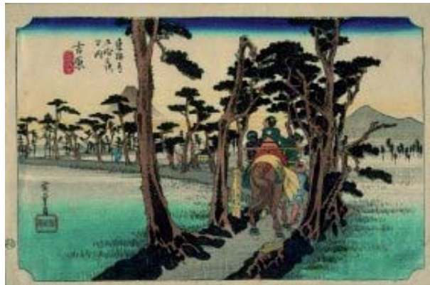
Sommerausstellung: Reisen im Land der aufgehenden Sonne. Meisterwerke des japanischen Holzschnitts aus der Kunsthalle Bremen

Unsere Städtische Galerie Bietigheim-Bissingen präsentierte die Ausstellung „Reisen im Land der aufgehenden Sonne – Meisterwerke des japanischen Holzschnitts aus der Kunsthalle Bremen“. In der Ausstellung wurden rund 150 Blätter aus der umfangreichen Sammlung der Kunsthalle Bremen kombiniert mit Objekten aus dem Lindenmuseum Stuttgart gezeigt. Im Mittelpunkt der beeindruckenden Ausstellung stand das Landschaftsmotiv. Im umfangreichen Rahmenprogramm der Galerie waren selbstverständlich auch wieder Workshops, Führungen und weitere tolle Angebote mit dabei.