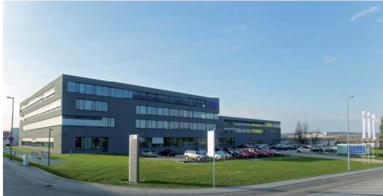
Firmengelände Dürr Systems GmbH in Bissingen