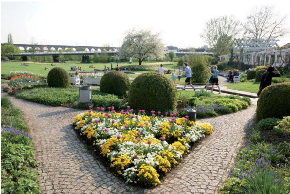
„Grüne Mitte Bietigheim-Bissingen“

Die B-Klasse-Mädchen des Bietigheimer Hockey- und Tennisclubs bewiesen bei den baden-württembergischen Meisterschaften Nervenstärke und holten sich vor rund 200 Zuschauern vor heimischer Kulisse den Titel.