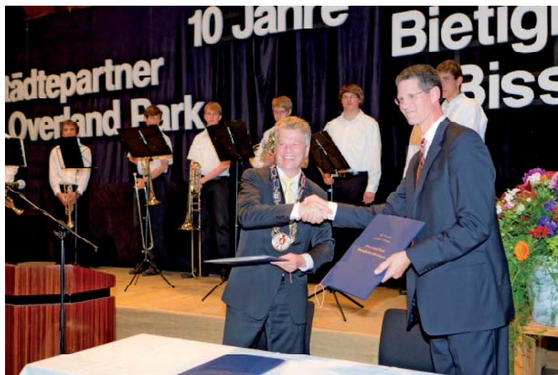
10 Jahre Städtepartnerschaft Bietigheim-Bissingen / Overland Park

Die Schule im Gröninger Weg bietet heute ein umfassendes Angebot von der Frühförderung bis zur Begleitung des Lebens nach der Schule. Seit über zehn Jahren gibt es beispielsweise Außenklassen der Förderschule an der Hauptschule im Buch, der Grundschule Weimarer Weg sowie an der Realschule im Aurain, um die Integration der behinderten Kinder in den normalen Schulalltag voran zu treiben.