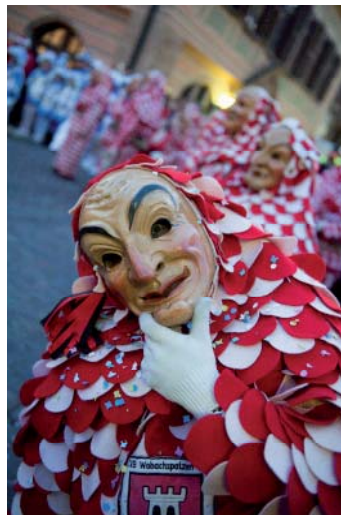
Rathaussturm am „schmutzigen Donnerstag“

Wieder versuchte ich mit kräftiger Unterstützung zahlreicher Stadträte, am „schmutzigen Donnerstag“ das Rathaus zu verteidigen. Doch die Wobachspatzen stürmten mit vereinten Kräften der Buchfinken, Würmlesbader und anderer Vereine und Guggenmusiker und eroberten meinen Amtssitz. Nach erfolgreicher Schlüsselübergabe an das Prinzenpaar feierten die Stadtnarren dann noch bis weit in die Nacht hinein in unserer Bietigheimer Altstadt.