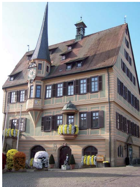
Bietigheimer Rathaus am Marktplatz

Ich bin froh und dankbar, dass ich Ihnen in diesem Jahr wieder viele gute Nachrichten aus Bietigheim-Bissingen übersenden kann. Noch nicht alles ist geglückt, viele Entwicklungen laufen langsamer ab, als wir uns dies wünschen, wir werden jedoch weiter intensiv daran arbeiten, dass sich unsere Stadt gut weiterentwickelt. Im Einzelnen ist im ablaufenden Jahr 2010 vieles geschehen, was die Bürger dieser Stadt bewegt, erfreut und manchmal auch betrübt hat. Lesen Sie auf den folgenden Seiten, was im Einzelnen geschehen ist.