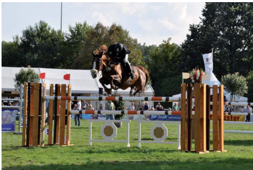
Springreiten beim Bietigheimer Pferdemarkt

Bei schönstem sonnigen Wetter und angenehmen Temperaturen um die 20 Grad konnte der Bietigheimer Pferdemarkt 2010, das mittlerweile größte Fest seiner Art im württembergischen Unterland, wieder einmal alle Erwartungen erfüllen. Nach fünf tollen Tagen zogen die Organisatoren, der Festwirt sowie die Schausteller eine durchweg positive Bilanz. 114 Reiter mit 413 Pferden zeigten in 11 S-Springwettbewerben auf dem Reitplatz am Viadukt ihr Können. Vor allem die Qualifikationsprüfungen für das BW-Bank-Hallenchampionat und den European Youngster Cup lockten die zahlreichen Reiter an. Aber auch die Nachwuchspferdetrophy und natürlich der „Große Preis der Stadt Bietigheim-Bissingen“ waren Höhepunkte des Turniergeschehens. In diesem Jahr neu hinzugekommen ist eine Qualifikation zur German Horse Pellets Tour sowie eine Lifestyle-Messe Open-Flair hinter dem Viadukt, bei der 29 Aussteller den Besuchern ausgefallene, schöne und leckere Dinge aus den Bereichen Mode & Accessoires, Kunsthandwerk, Schmuck, Dekorationen, Kunst, Kulinarisches, Sport & Fitness sowie Pferd & Hund präsentierten. Auch die Geschäfte in unserer schönen Altstadt öffneten am Sonntag von 13 bis 18 Uhr ihre Ladentüren und lockten mit Angeboten viele Besucherinnen und Besucher an – und so ging ein rundum gelungener Pferdemarkt 2010 zu Ende!