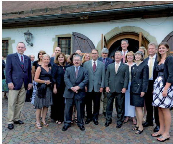
Delegation aus Overland Park anlässlich Partnerschaftsfeier

Freundschaftliche Beziehungen sind nach regen Austauschen mit Musikschule, Orchestern und Schulen entstanden und sollen auch weiter gefestigt werden. Der Festabend wurde musikalisch umrahmt vom Blechbläserensemble der Städtischen Musikschule. Für die amerikanische Delegation standen unter anderem Ausflüge nach Stuttgart, ins Römermuseum Walheim und eine Fahrt durch die Felsengärten in Besigheim auf dem Programm.