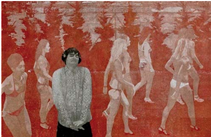
Linolschnitt heute VIII. Grafikpreis der Stadt Bietigheim-Bissingen

Bereits zum achten Mal vergab unsere Städtische Galerie den Grafikpreis „Linolschnitt heute“, mit dem zeitgenössische Künstlerinnen und Künstler in dreijährigem Rhythmus gefördert werden. In diesem Jahr beteiligten sich mehr als 600 Künstler aus aller Welt an dem Wettbewerb. Die Ausstellung präsentierte neben den Werken der Preisträger auch eine von der Jury getroffene Auswahl und bot somit einen repräsentativen Einblick in den aktuellen künstlerischen Linolschnitt. Großzügig unterstützt wurde der Wettbewerb wieder von der Firma Armstrong DLW.