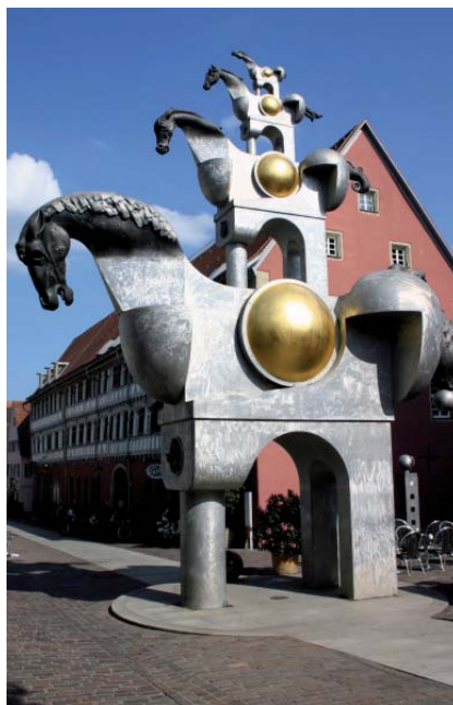
„Turm der Grauen Pferde“ am Hillerplatz

Ihr 60-jähriges Jubiläum feierte die Schillerschule mit einem Sportfest unter dem Motto „Sport macht Freude“. Rund 250 Kinder tobten sich auf dem großen Spielparcour bei Tauhängeln, Büchsenwerfen und Geschicklichkeitsspielen aus und auch zahlreiche Eltern waren aktiv mit von der Partie. Am Abend wurde dann noch mit einem offiziellen festlichen Teil das Jubiläum gefeiert.