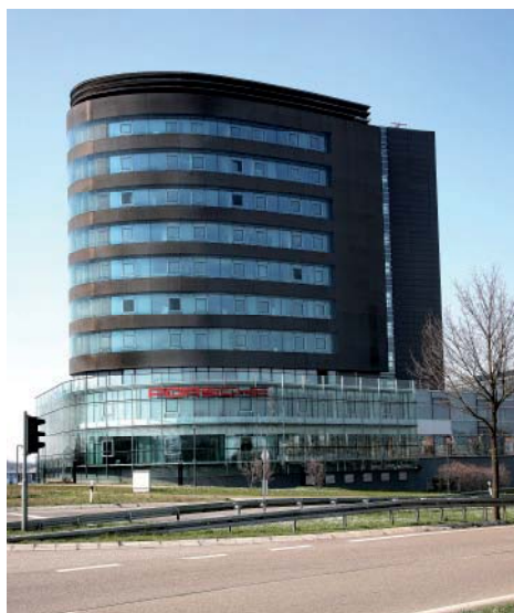
Firmengebäude der Firma Porsche am Ortseingang von Ludwigsburg kommend