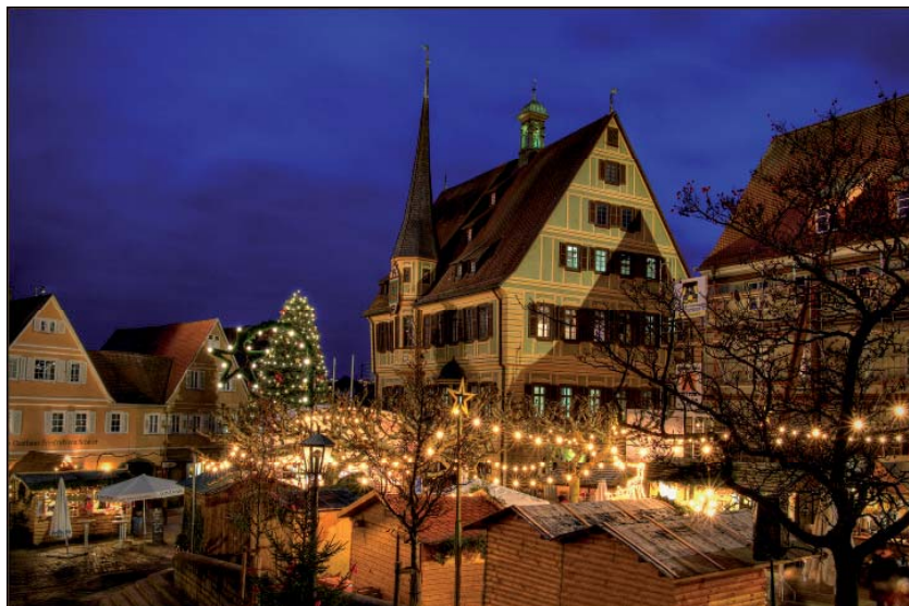
Sternlesmarkt rund um den Marktplatz

Eine wichtige Aufwertung unserer Einkaufslandschaft konnten wir in der Talstraße ansiedeln. Der Schuhhersteller Sioux eröffnete ein neues Factory-Outlet. Der Werksverkauf am Stammsitz in Walheim wurde geschlossen. Im gleichen Gebäude wie der Edelschuhhersteller Dinkelacker bietet Sioux nun im Erdgeschoss auf eine Fläche von rund 500 Quadratmetern Markenschuhe des Unternehmens zum Verkauf.