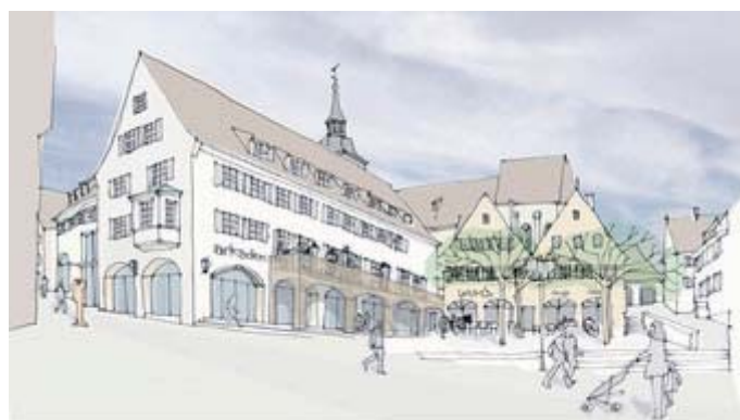
„Marktplatz-Arkaden“ - Architekten-Skizze

Es geht jedoch nicht nur in der Industrie, sondern auch im Handwerk und im Einzelhandel aufwärts. Unser großes Möbelhaus Hofmeister expandiert. Das bereits in vierter Generation geführte Familienunternehmen hat im Jahr 2009 ein zweites großes Möbelhaus in Leonberg eröffnet, und plant nun eine Dependence in Sindelfingen. Das Haus in Bietigheim-Bissingen mit seinen rund 50.000 qm Verkaufsfläche ist seit vielen Jahren ein starker Anziehungspunkt des Einzelhandels in unserer Stadt. In wesentlich kleineren Dimensionen, jedoch nicht minder aktiv ist der Einzelhandel in unserer Altstadt. Im letzten Jahr musste ich Ihnen leider berichten, dass das ehemalige Hertie-Haus am Kronenplatz nicht mehr zu halten war und geschlossen wurde. Nun kommt die positive Meldung: Wir haben einen neuen Investor gefunden, der das Haus umbauen und erweitern will. Nach dem Abriss des benachbarten alten Postgebäudes ist ein Anbau geplant, der mit den beiden Handelsebenen im Erdgeschoss und im ersten Obergeschoss der Kronenzentrums verbunden werden soll. Auf rund 5.000 qm Fläche werden dann neue, attraktive Einzelhandelsgeschäfte voraussichtlich im Herbst 2011, spätestens aber im Frühjahr 2012 einziehen. Zu diesem Zeitpunkt wollen wir auch den Umbau unseres Arkadengebäudes am Bietigheimer Marktplatz beenden. In die ‚Marktplatz-Arkaden‘ sollen dann auf rund 1.000 qm Nutzfläche ebenfalls Läden und evtl. gastronomische Betriebe Einzug halten.