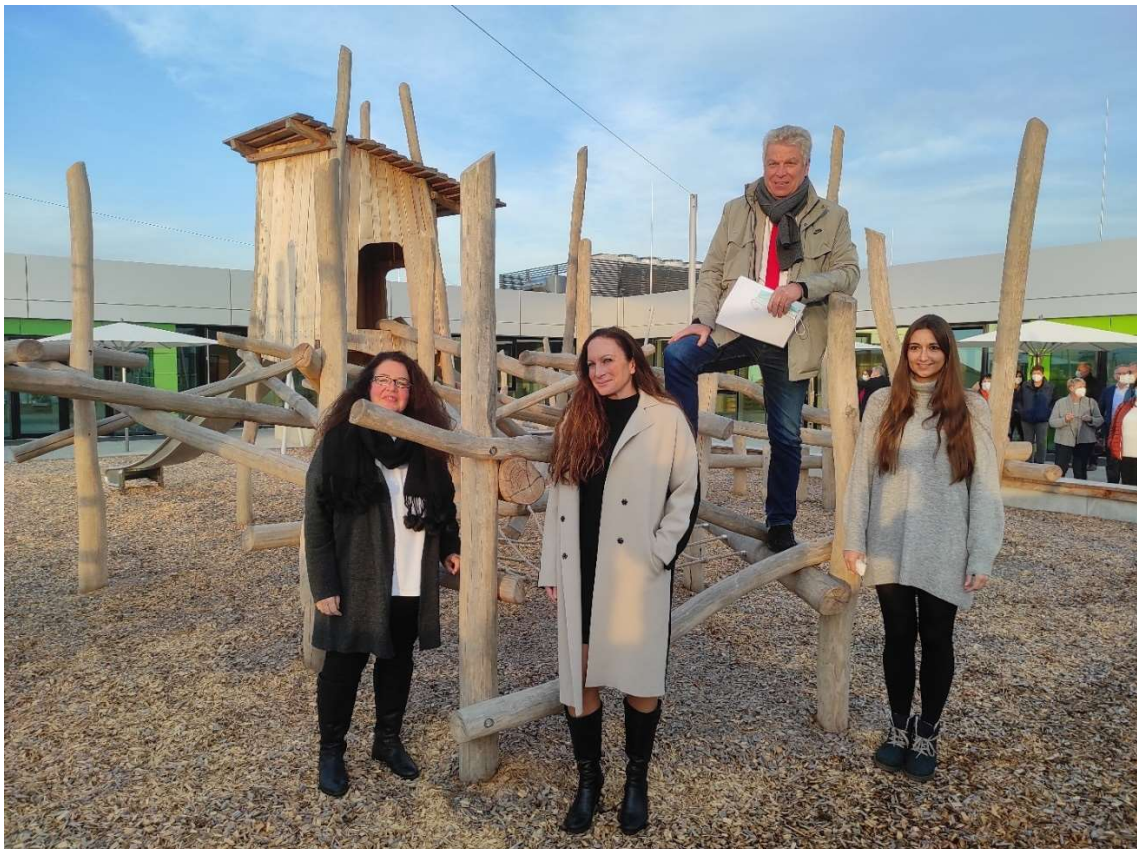
Foto: Einweihung Kinderhaus Domino

Feierlich durfte ich das neue Kinderhaus Domino über dem Lidl-Markt in der Gustav-Rau-Straße einweihen. Über 1300 Quadratmeter samt Außenfläche bieten Platz für vier neue Betreuungsgruppen für mehr als 60 Kinder unter und über drei Jahren. Für die Eltern, die ihre Kinder mit dem Auto zum Kinderhaus Domino bringen, wurden extra Stellplätze vor dem Markt angeordnet.