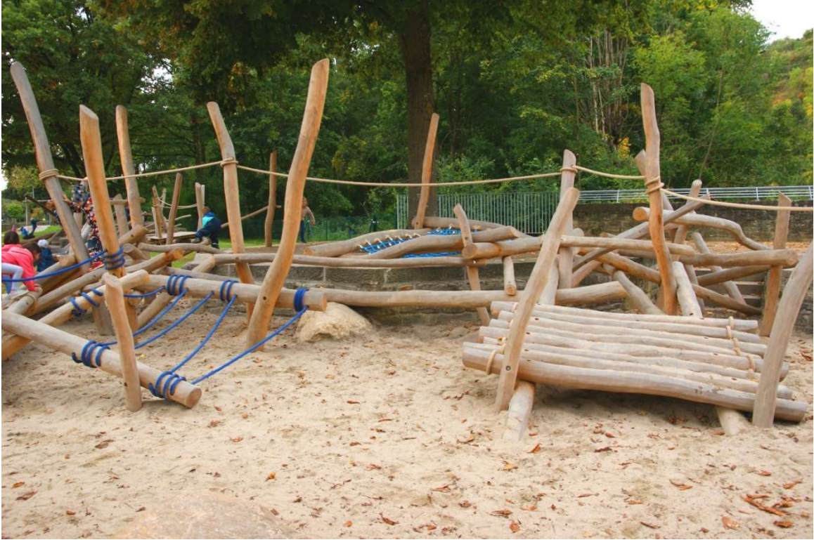
Foto: Spiel- und Rastplatz Flößerstraße in Bissingen

Sand bietet den Kindern viel Gelegenheit zum Spielen. Auch Erwachsene finden auf Sitz- und Liegeflößen, Floßbänken, einer drehbaren Sonnenliege und noch vielem mehr Möglichkeiten zum Aufenthalt. Als besondere Attraktion entstand ein Aussichtsbalkon zur Enz.