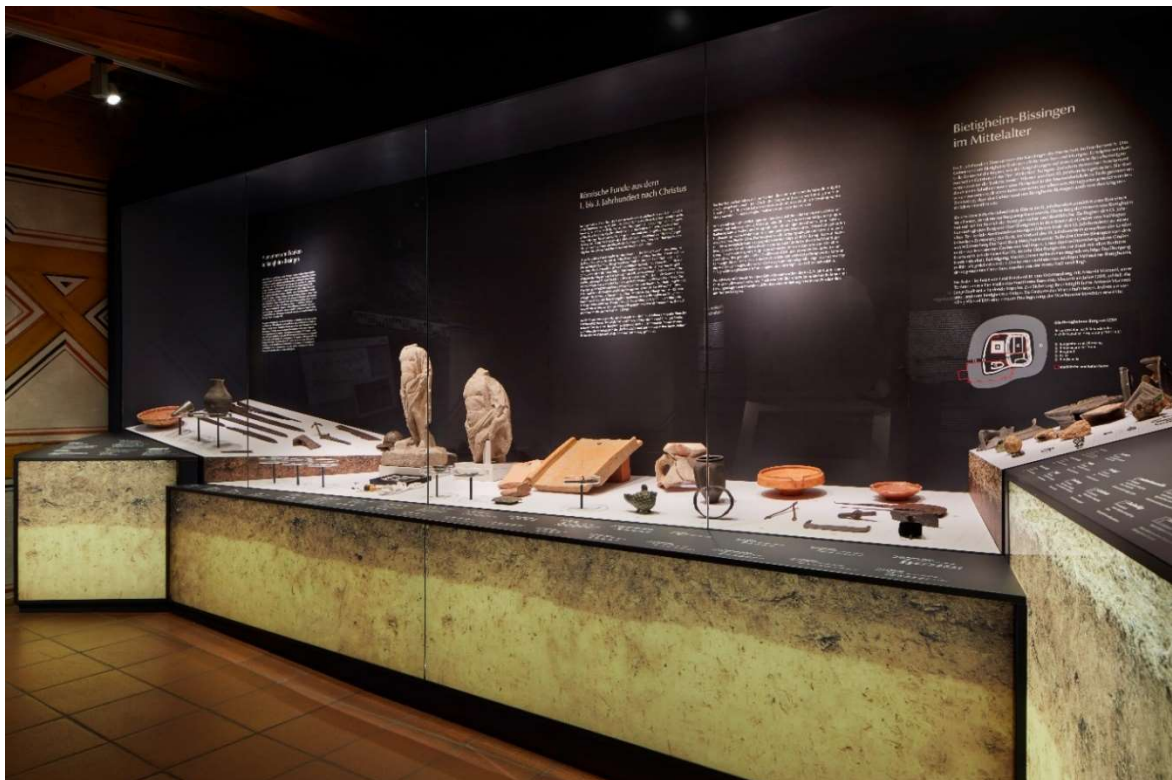
Foto: Archäologischer Raum, Stadtmuseum Hornmoldhaus

Unser Stadtmuseum Hornmoldhaus eröffnete einen neuen Raum für archäologische Funde aus den unterschiedlichen Epochen von Bietigheim-Bissingen. Zu sehen gibt es eine Römerin, ein Burgfräulein, einen Legionär, einen Ritter und eine holde Maid. Die Funde stammen aus der Vor- und Frühgeschichte der Stadt und wurden meist im Zusammenhang mit neuen Bauprojekten wie dem Ausbau der Bundes- und Kreisstraße oder der Ansiedlung von Firmen in den Gewerbegebieten „Bruchwald“ in Bissingen und „Seewiesen/Büttenwiesen“ entdeckt. Die Objekte stammen aus der Jungsteinzeit, der Römerzeit, aus der Zeit der Alamannen und aus dem Mittelalter.