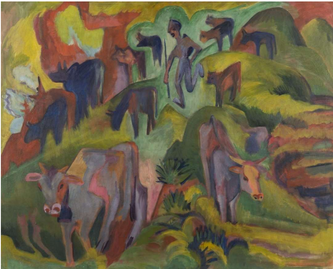
Foto: Ernst Ludwig Kirchner, Absteigende Kühe, 1920, Öl auf Leinwand, Georg Kolbe Museum, Berlin

Unsere Städtische Galerie zeigte die neue Ausstellung „Ernst Ludwig Kirchner. Tierleben in den Davoser Alpen“. Zu sehen gab es insgesamt 70 Werke mit Tierdarstellungen, die durch Kirchners Fotografien der Tiere, Bauern und Weggefährten in der Davoser Alpenlandschaft ergänzt wurden. Anlässlich der Ausstellung gab es neben den heimischen Nutztieren – wie sie auch Kirchner in Szene setzte – viele wilde, exotische Tiere, Meeresgetiere und Fabelwesen, wie auch Vögel und Insekten zu sehen.