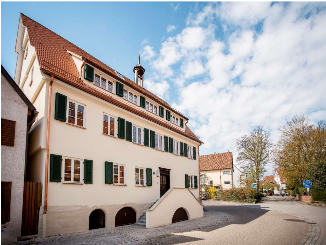
Altes Rathaus Bissingen

Nach rund 20 Monaten ist das alte Bissinger Rathaus fertig saniert und bezugsfertig. Entstanden sind vier Wohnungen, zwei Zwei-Zimmer-Wohnungen mit 31 und 38 Quadratmetern, eine Drei-Zimmer-Wohnung mit 82 Quadratmetern und eine Vier-Zimmer-Wohnung mit 98 Quadratmetern. Bei der Sanierung des denkmalgeschützten Gebäudes musste die Bietigheimer Wohnbau vieles beachten. So wurde im Hausflur Krenzheimer Muschelkalk verlegt, die alten Steine vom Brunnen wurden einzeln entnommen, nummeriert, gereinigt und an den ursprünglichen Platz gesetzt. Beim Austausch der maroden Balken wurde das Fichten- und Eichenholz aus dem Schwarzwald verwendet. Aber es hat sich gelohnt. Das Gebäude von 1569 versprüht jetzt wieder seinen alten Charme.