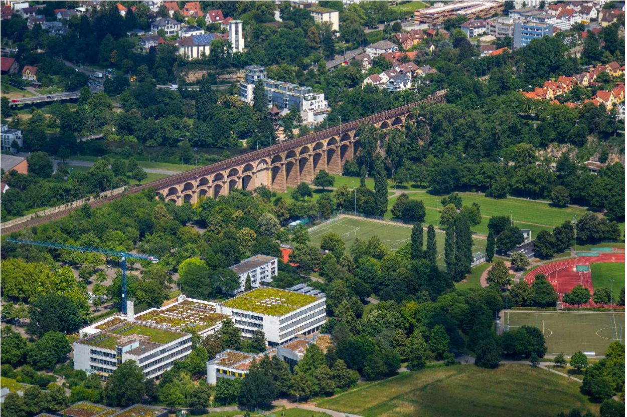
Foto: Luftansicht Ellentalgymnasien

Auf den folgenden Seiten erfahren Sie, welche großen und kleinen Ereignisse im Laufe des Jahres 2021 stattfinden konnten. Lassen Sie sich überraschen, wie vielfältig die städtische Gemeinschaft ist.