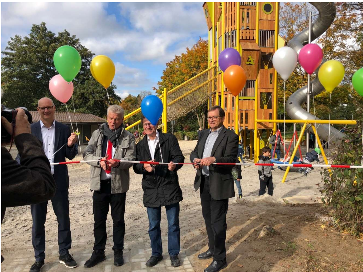
Foto: Spielturm Wobachstraße

Endlich war es soweit: feierlich durfte ich den neuen Spielturm in der Bietigheimer Wobachstraße freigeben. Die Kinder rutschten und kletterten mit Begeisterung auf dem Turm. Der Spielturm ist nicht komplett aus Holz, sondern hat ein Stahlkorsett und wurde mit Robinien- und Nadelholzwänden und Podesten, Kletternetzen, Leitern und anderen Aufstiegsmöglichkeiten ausgestattet. Neue Schaukeln, Wippen und Sandspielflächen ergänzen den Turm. Unterstützt hat das Vorhaben der Verband Region Stuttgart im Rahmen des Projekts Landschaftspark entlang der Flusstäler sowie die Firma Dürr Dental.