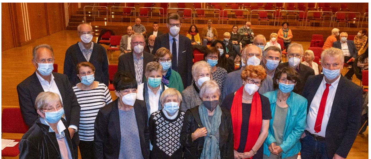
Foto: Soziale Ehrung der Stadt Bietigheim-Bissingen