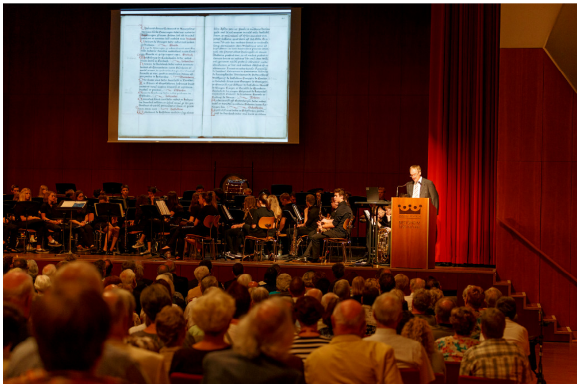
Bild: Festakt 650 Jahre