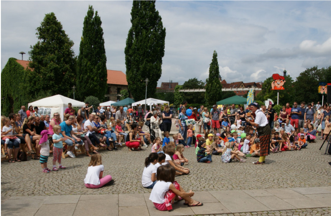
Bild: Kinder- und Familientag