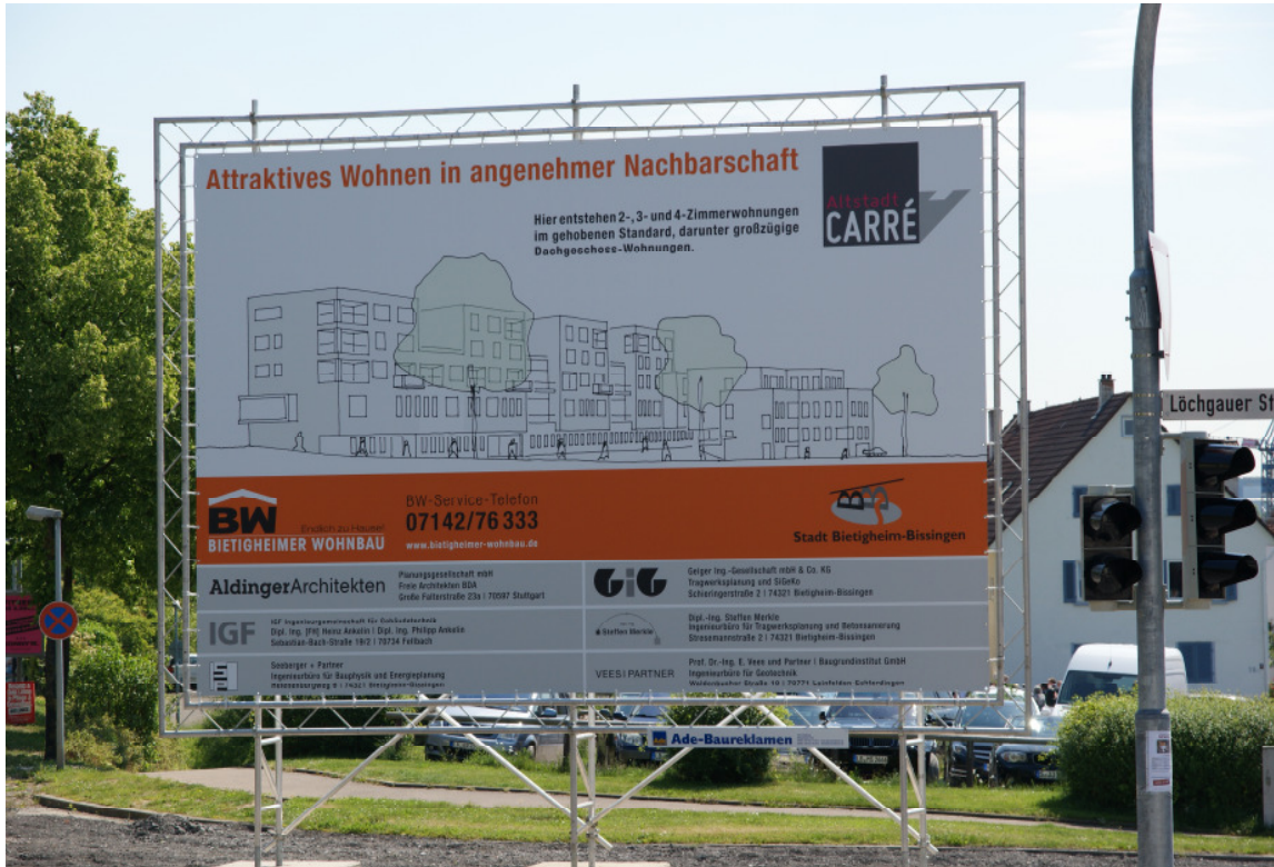
Bild: Altstadt Carree