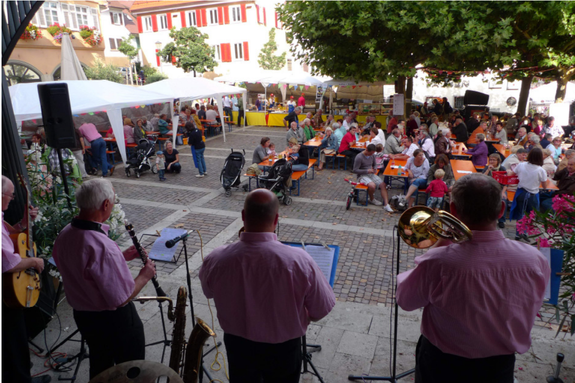
Bild: Arkadenfest 2014 Enzdown-Dixies