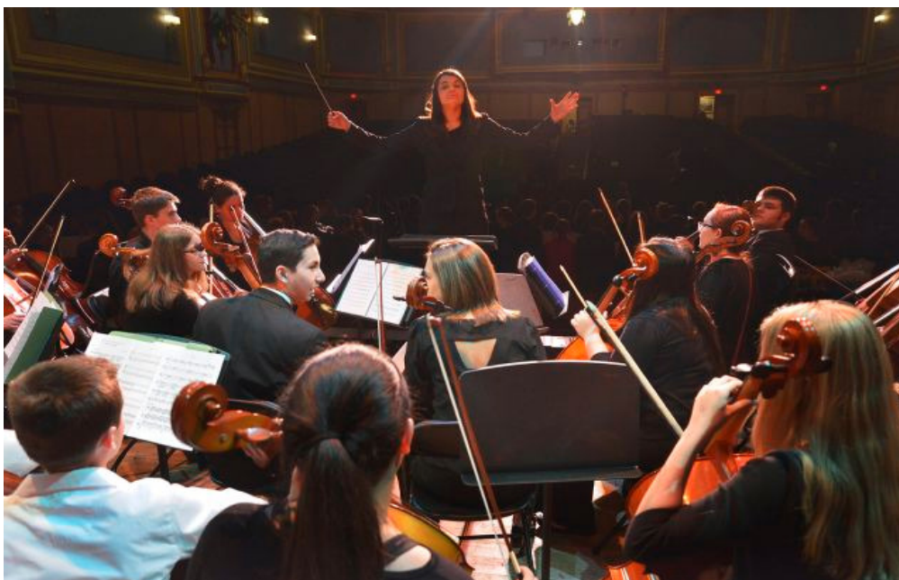
Bild: Musikschule Austauschkonzert Downers Grove

Drei Orchester der Musikschule Bietigheim-Bissingen begaben sich auf eine Konzertreise in die USA. Ziel waren die Städte Overland Park und Downers Grove, in denen das Jugendstreichorchester, das Blockflötenorchester sowie das Gitarrenorchester auftreten werden. Diese gemeinsame Reise hat für die Musikschule eine lange Tradition, denn die freundschaftlichen Beziehungen bestehen seit dem Jahr 1979. Die Musikschule und die High School in Overland Park sind Garanten für die Städtepartnerschaft zwischen unserer Kommune.