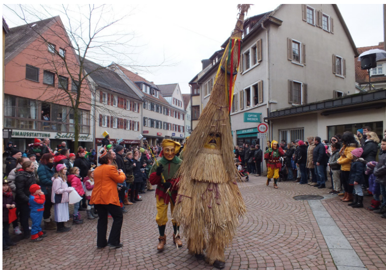
Bild: Fasnetsumzug Wobachspatzen

Der Narrenbaum wurde erstmals vor dem „schmotz’gen Donnerstag“ von den Buchfinken und Wobachspatzen still und heimlich vor dem Bietigheimer Rathaus aufgestellt. Doch auch in diesem Jahr war der Widerstand beim Rathaussturm vergeblich: nach längerer Belagerung und Angriffen der Buchfinken und Wobachspatzen musste ich mich geschlagen geben. Sie setzten Warnschilder, Absperrbänder und sogar ein Sprungtuch ein, um die bürokratische Verordnungsmacht zu demonstrieren. Nach der Machtübernahme feierten die Narren ausgiebig in der Kelter mit lauter Guggenmusik bis spät in die Nacht. Großen Ansturm erlebte auch die Prunksitzung der Buchfinken im Kronenzentrum. Rund 350 Gäste lockte die Karnevalsgesellschaft zu ihren Vorführungen. Zum ersten Mal organisierten die Wobachspatzen und Buchfinken einen gemeinsamen großen Fasnetsumzug in der Bietigheimer Altstadt. Mehr als 100 Gruppen trieben ihren Schabernack in der Altstadt und feierten die fünfte Jahreszeit mit den Besuchern. Ein besonderes Ereignis war der Besuch der Kolping-Fanfarengruppe aus Tannesberg in Sachsen. Doch die Vielfalt der Hästräger, der Masken in ihren verschiedenen Ausprägungen, begeisterte vor allem tausende Zuschauer entlang der Strecke. Stundenlang feierten 3500 Narren mit den Gästen.