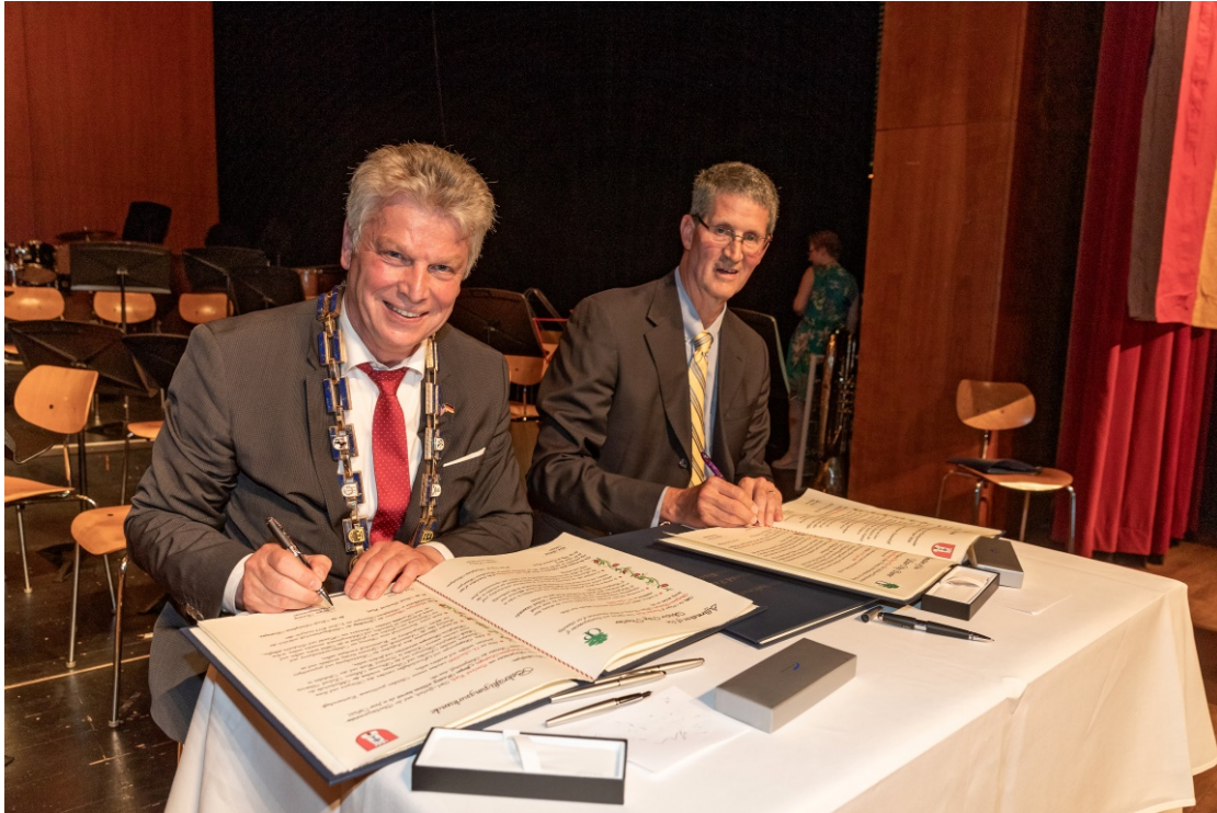
Foto: 20 Jahre Städtepartnerschaft zwischen Bietigheim-Bissingen und Overland Park

In der EgeTrans-Arena fand das 38. Festival der Pontos-Griechen Europas statt. Rund 1400 Tänzer und 2500 Gäste waren zur Andacht der 353 000 Opfer des Völkermordes, welchen die Osmanen in der Zeit von 1916 bis 1923 ausgeübt hatten, gekommen. Ganz traditionell traten Tänzer in Volkstrachten auf, Musiker schlugen auf Pauken und hunderte hochgehobene Arme bewegten sich zeitgleich. Die Pontos-Griechen lebten vor dem ersten Weltkrieg entlang der Südküste des Schwarzen Meeres, in Kleinasien, und wurden 1919 von den Türken vertrieben oder ermordet.