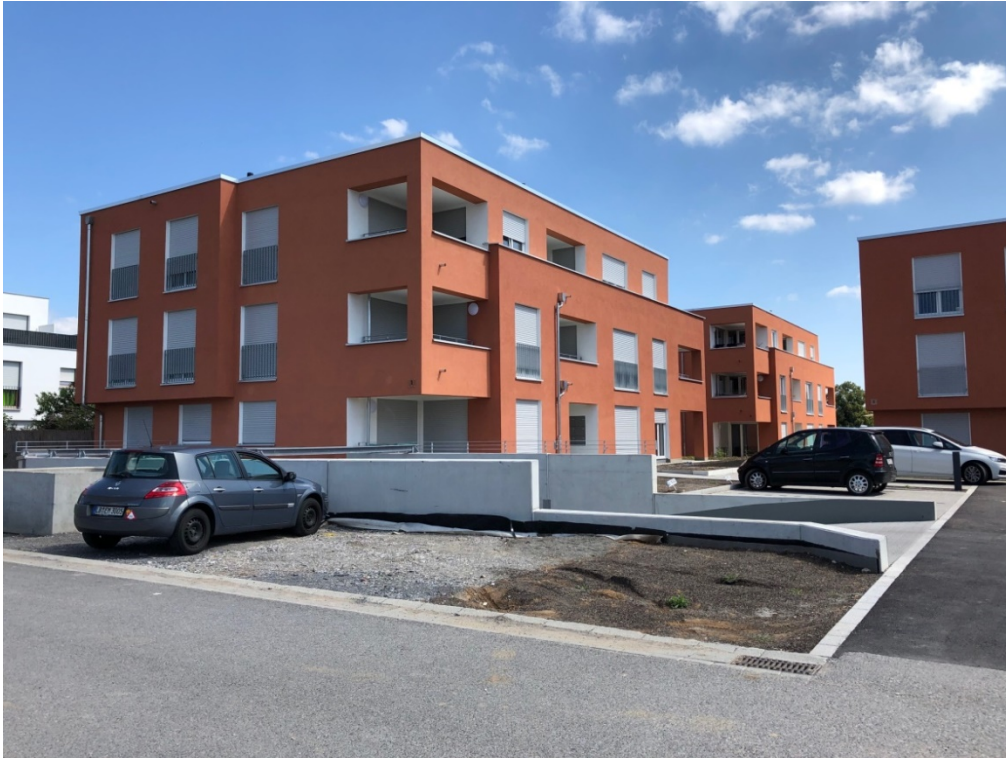
Foto: Freda-Wüsthoff-Straße, Bürgerstiftung, Bezahlbarer Wohnraum

Liebe ehemalige Bietigheim-Bissingen, die Stadt hat sich auch in diesem Jahr sehr positiv entwickelt. Gute Arbeitsplätze, eine hervorragende Infrastruktur, aktive Vereine und viele ehrenamtlich mitarbeitende Bürgerinnen und Bürger sichern Wohlstand, Freizeiterlebnisse und Fürsorge auch in Notfällen. Dafür bin ich sehr dankbar. Wir arbeiten daran, dass dies so bleibt. Lesen Sie auf den folgenden Seiten, was sich im Einzelnen in den letzten 12 Monaten ereignet hat.