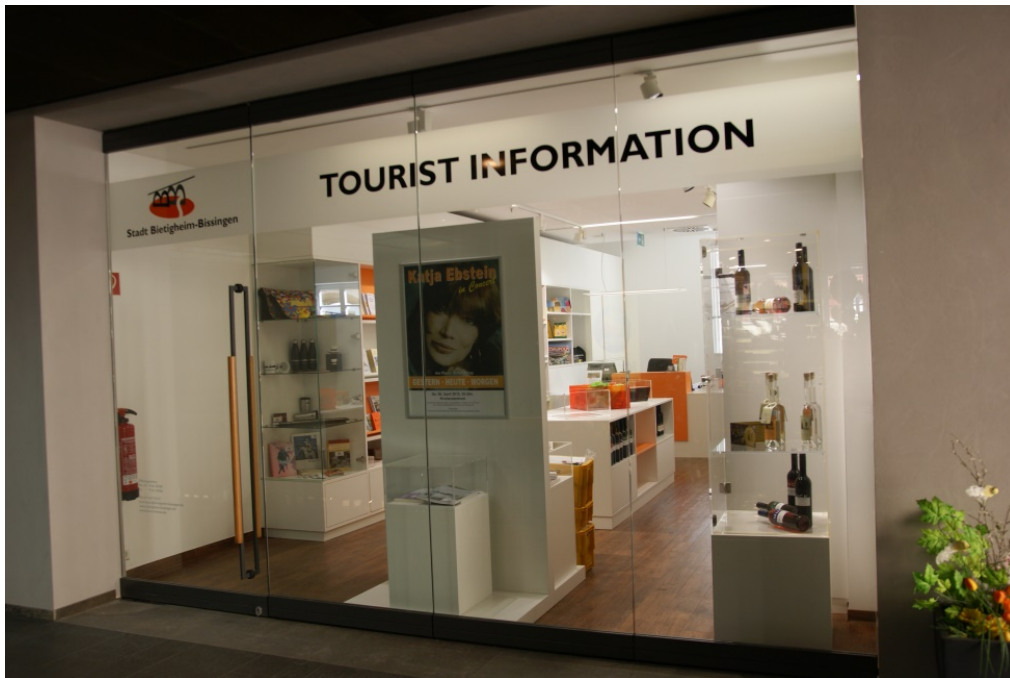
Foto: Tourist Information in den Marktplatz Arkaden

Unsere Tourist Information ist in die Marktplatz Arkaden umgezogen. Nachdem der ehemalige Laden der Felsengartenkellerei frei wurde, den diese Ende 2016 geräumt hat, haben wir die Chance genutzt. Die Tourist Information ist nun barrierefrei gut zugänglich. Auch der öffentliche Bereich ist nun größer und heller.