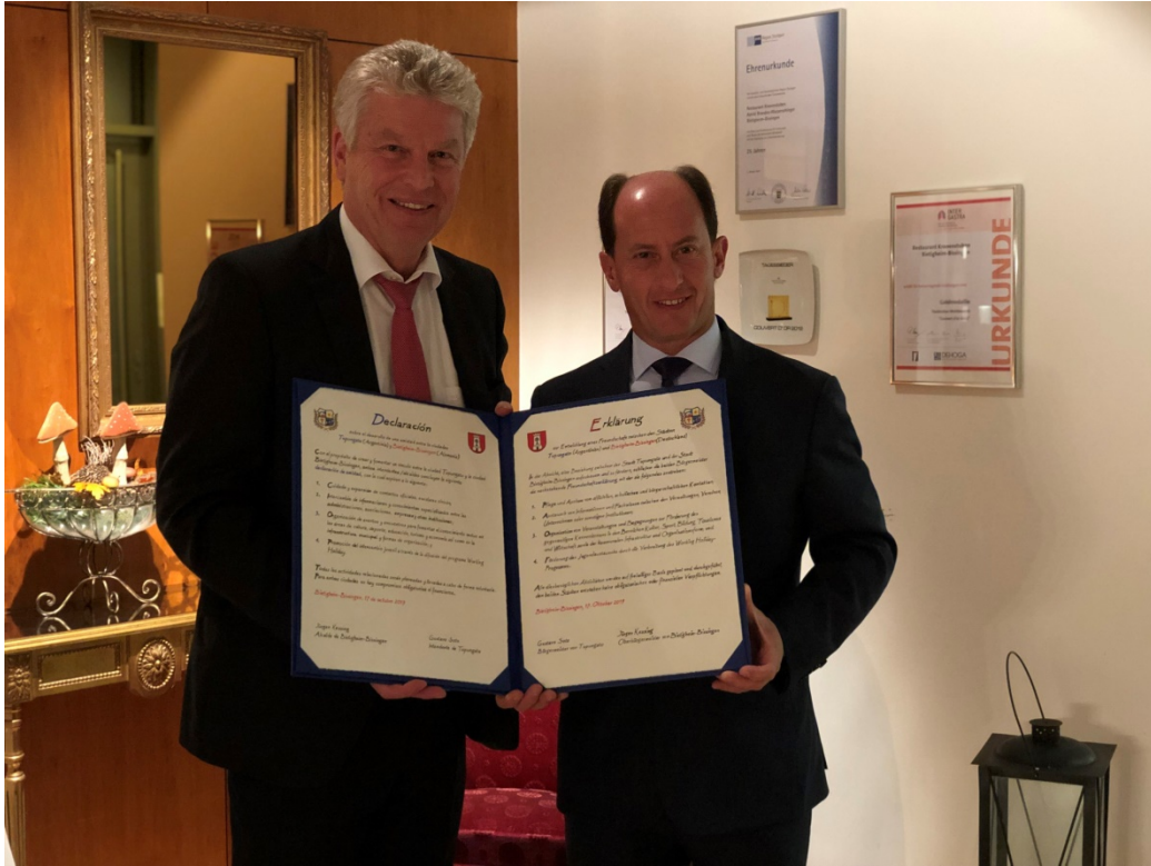
Foto: Festabend mit Gästen aus Tupungato

zu Besuch in Tupungato und habe mir einen ersten Eindruck verschafft. Die Stadt liegt am Rand der Anden und hat eine große Weinbautradition.