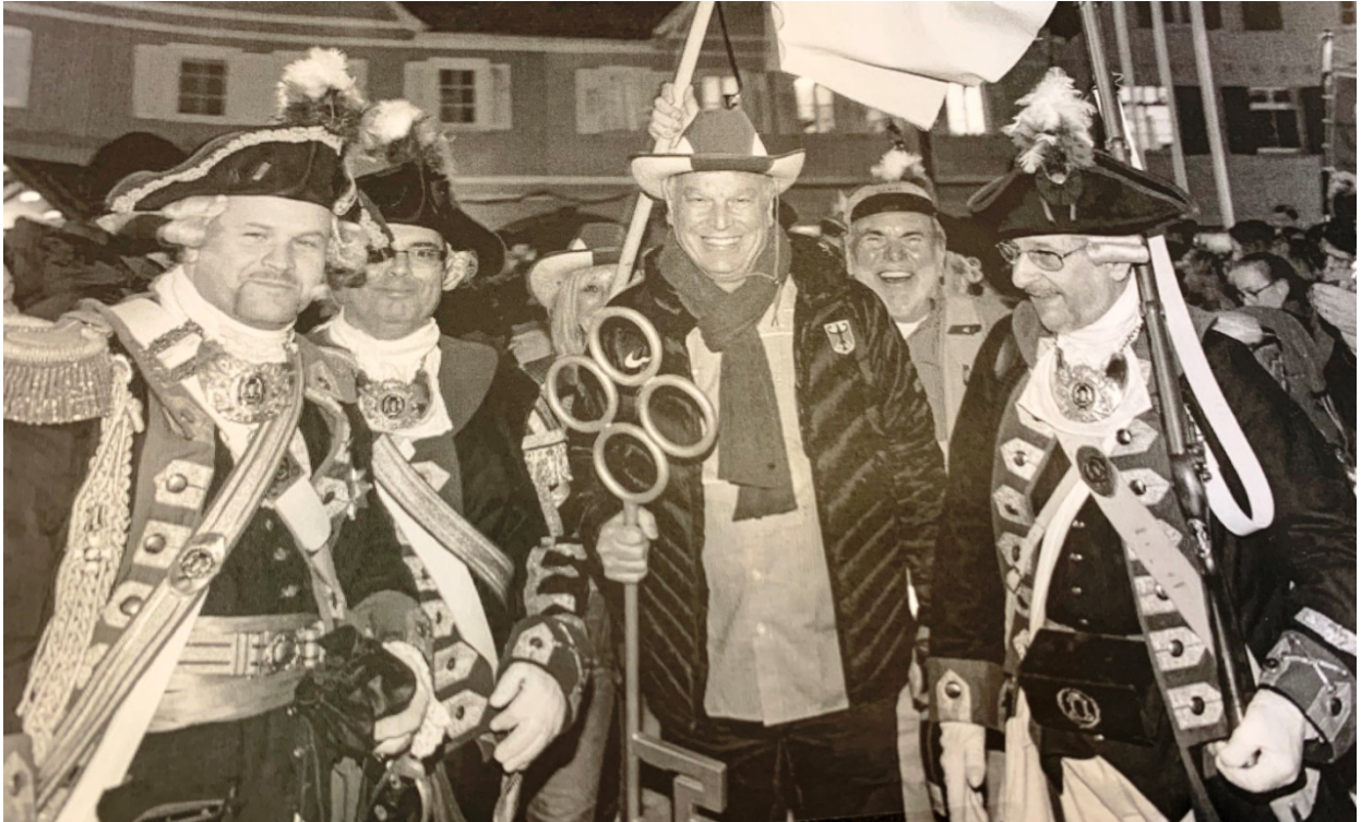
Foto: Rathaussturm 2019

Auch in diesem Jahr war der Widerstand beim Rathaussturm am „schmotz´gen Donnerstag“ vergeblich: nach längerer Belagerung musste ich mich zusammen mit meinen Kampfgefährten den Narren geschlagen geben und dem Prinzenpaar den Rathausschlüssel übergeben. Nach der Machtübernahme wurde in der Kelter bis spät in die Nacht kräftig weitergefeiert. Großen Ansturm erlebten auch die Prunksitzungen der Buchfinken und der Wobachspatzen.