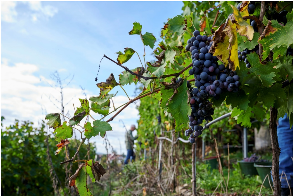
Weinlese

Viel Freude macht uns in diesem Jahr ein Traditionsgewerbe: der Weinbau. Er ist zwar nicht mehr so dominant wie in früheren Jahrhunderten, aber die Steillagen entlang der Flusstäler an Enz und Metter prägen unsere Landschaft und bescheren uns immer noch gute Tropfen Wein. Die Weinlese verlief in diesem Herbst sehr erfolgreich. Ein guter Mix aus Sonne, Regen und Wärme hat beste Voraussetzungen für einen guten Jahrgang geschaffen. Jetzt warten wir gespannt, bis die neue Ernte in den Fässern herangereift ist. Da die Kellermeister ihr Geschäft verstehen, können wir aromatische Weine erwarten.