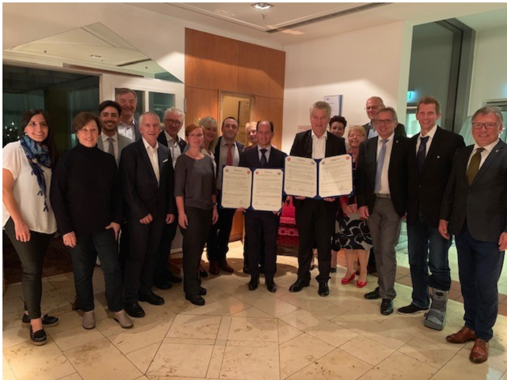
Foto: Festabend mit Gästen aus Tupungato