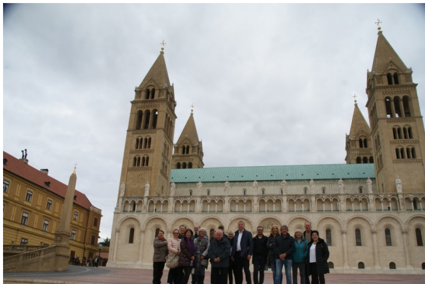
Foto: Delegation aus Bietigheim in Szekszárd/Ungarn