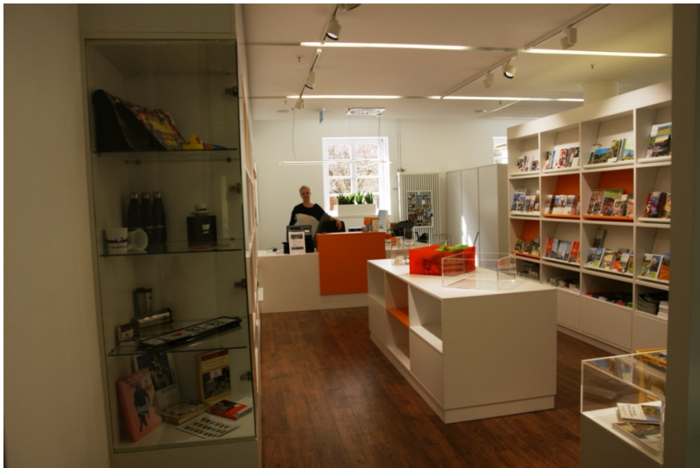
Foto: Tourist Information in den Marktplatz Arkaden