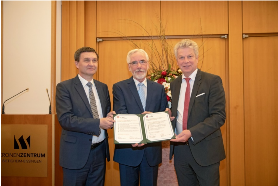
Foto: Jubiläum 30 Jahre Städtepartnerschaft zwischen Bietigheim-Bissingen und Szekszárd