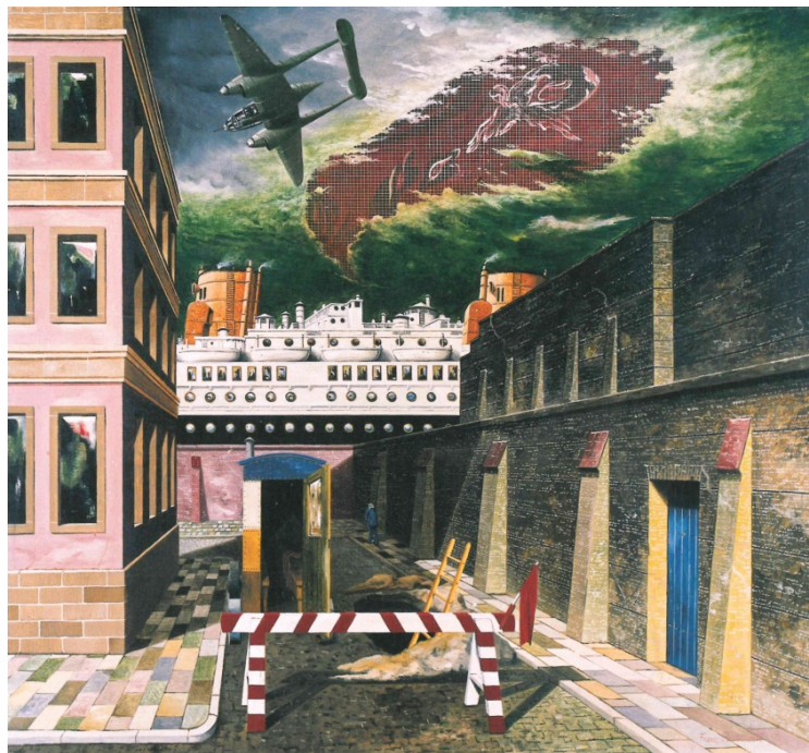
Franz Radziwill: Nach dem Unglück , 1949, Öl auf Leinwand auf Holz, 101 x 110 cm, Radziwill Sammlung Claus Hüppe, courtesy Kunsthalle Emden, © VG Bild-Kunst, Bonn 2019, Foto: Radziwill Sammlung Claus Hüppe

Unsere Städtische Galerie widmete sich den Werken des Malers Franz Radziwill. Die Malereien sind eine Art Wimmelbild für Fortgeschrittene, da es in der Mehrzahl der Bilder kein zentrales Motiv gibt. Die Begeisterung für die Natur, das Meer und die Errungenschaften der Technik spiegelt sich in fast allen seinen Werken.