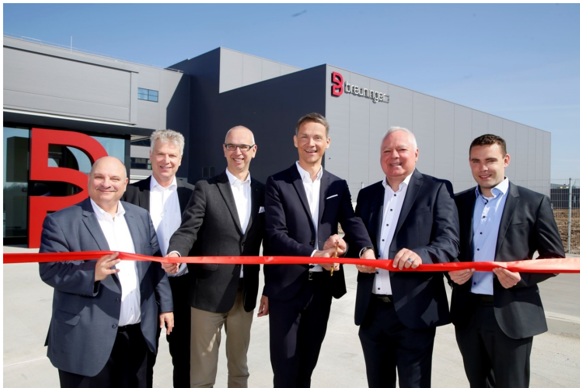
Foto: Stadt Sachsenheim, Eröffnung Breuninger im Gewerbegebiet Eichwald

dafür nötigen Stylisten, Fotografen, Designer usw. arbeitet von hier aus. Ebenfalls angesiedelt hat sich die Firma Dräxlmaier, die Batteriesysteme für den Automobilbau fertigt. Neben der Produktion ist auch die Entwicklungsabteilung hier zuhause. Richtung Ingersheim ist die Firmenzentrale von ACPS Automotive entstanden. Der Hersteller von Anhängervorrichtungen wechselt von Markgröningen hierher auf ein rund 10.000 qm großes Gelände. Rund 150 Mitarbeiter werden im nächsten Jahr die Arbeit aufnehmen. Dank der erfolgreichen Ansiedlungspolitik der letzten Jahre erhalten wir hohe Steuerzahlungen aus diesen Gewerbegebieten.