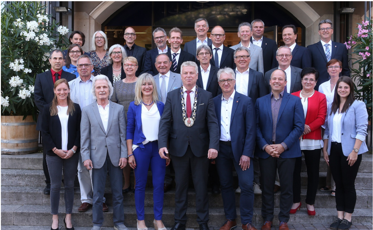
Foto: Gemeinderat 2019