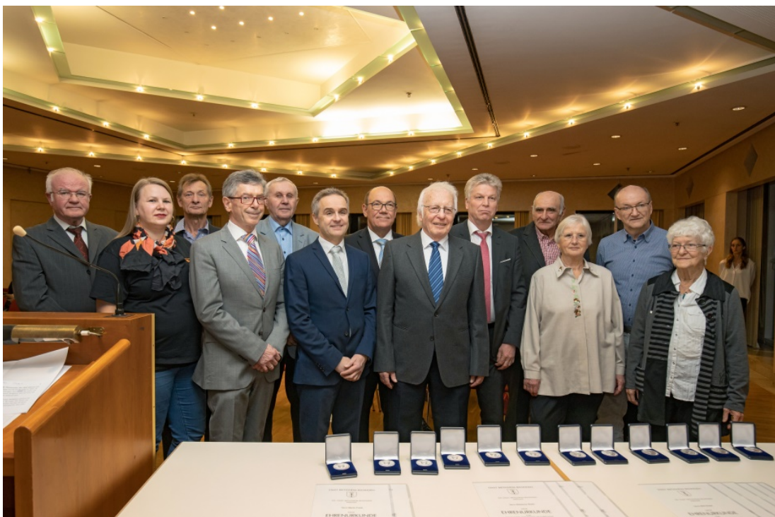
Foto: Ehrung Ehrenamt 2019