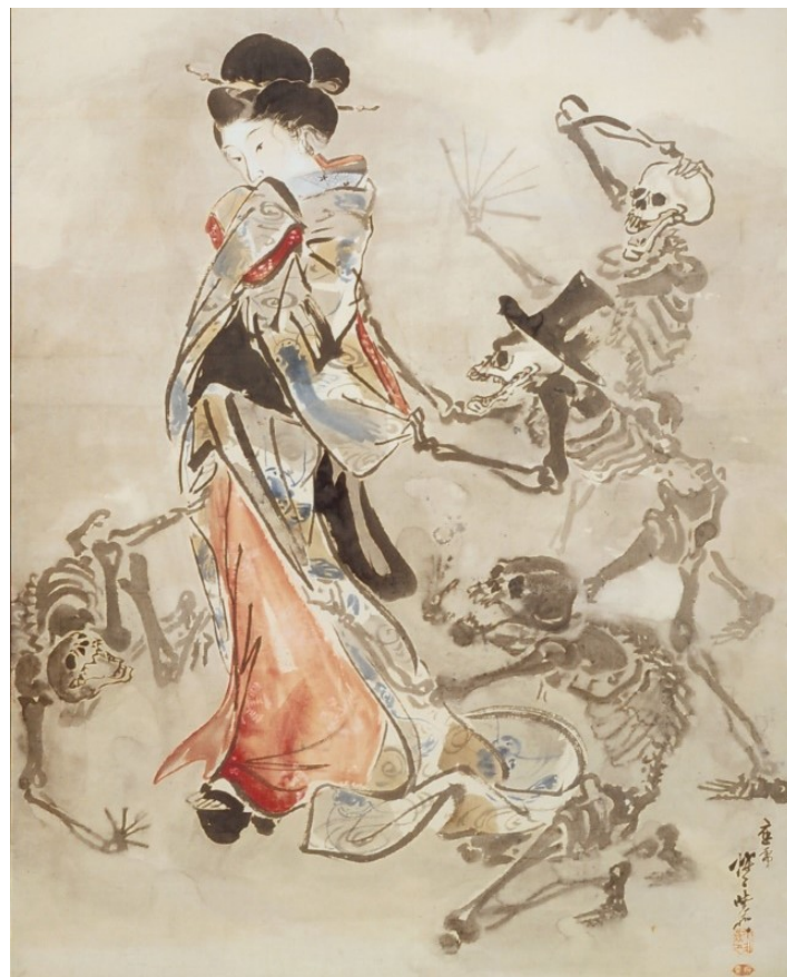
Foto: „Schöne von Skeletten umringt, nach 1871, Hängerolle, Tusche und leichte Farbe auf Papier

Unser Stadtmuseum Hornmoldhaus eröffnete eine neue Kabinettausstellung mit Werken des japanischen Künstlers Kawanabe Kyosai. Im Frühjahr 2019 wurde im japanischen Kobe eine große Ausstellung mit Werken dieses Künstlers gezeigt und das Stadtmuseum Hornmoldhaus steuerte sieben Werke dazu bei. Denn in den 50er-Jahren hat unser Museum rund 60 Werke des Künstlers erworben. Auf einem der Exponate konnten die Besucher eine junge Frau begleitet von Knochenmännern betrachten. Die Skelette sind ein Markenzeichen des Künstlers. Parallel dazu wurde im Museum auch das Kabinett über Erwin von Bälz, unseren Japanarzt, neu gestaltet.