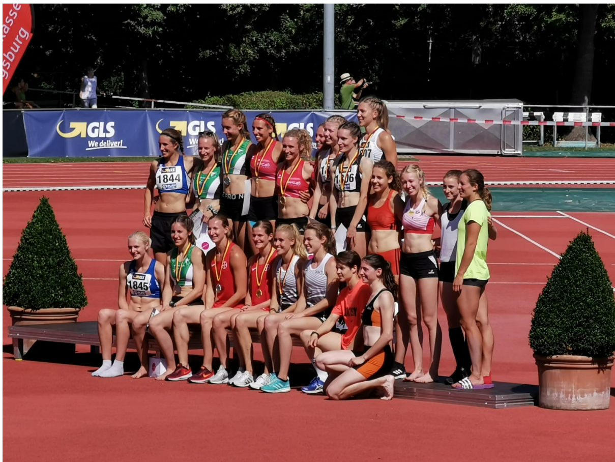
Foto: Deutschen Meisterschaften im Mehrkampf, Ellentalstadion