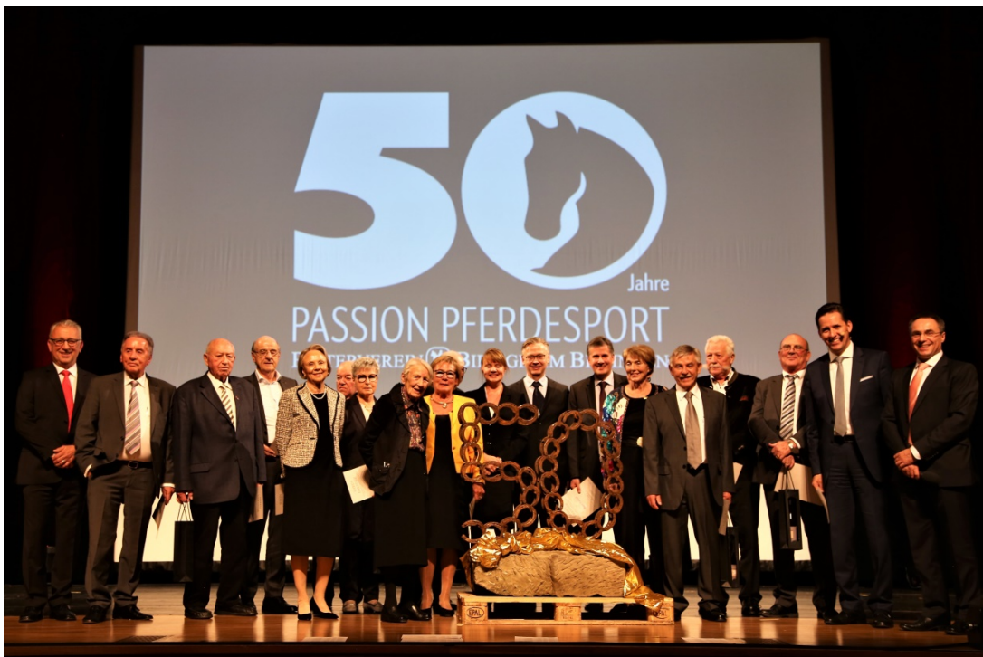
Foto: Jubiläum Reiterverein, Foto von Reiterverein Bietigheim-Bissingen

Der Reiterverein Bietigheim-Bissingen feierte sein 50-jähriges Bestehen. 1969 wurde der Reiterverein von einigen Pferdebegeisterten im Gasthaus Adler gegründet. Anfang 1970 zählte der Verein 70 Mitglieder. Heute hat der Reiterverein 560 Mitglieder. Im April 1970 wurde die Reitanlage im Erlengrund offiziell eröffnet und der Reitbetrieb gestartet. Im September 1970 beteiligte sich der Reiterverein zum ersten Mal am Pferdemarkt und ist bis heute dabei. Damals wurde auch die 800 Quadratmeter große Reithalle mit Vereinsheim gebaut.