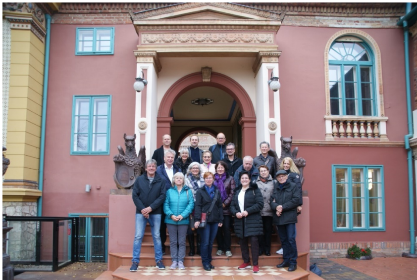
Foto: Delegation aus Bietigheim in Szekszárd/Ungarn