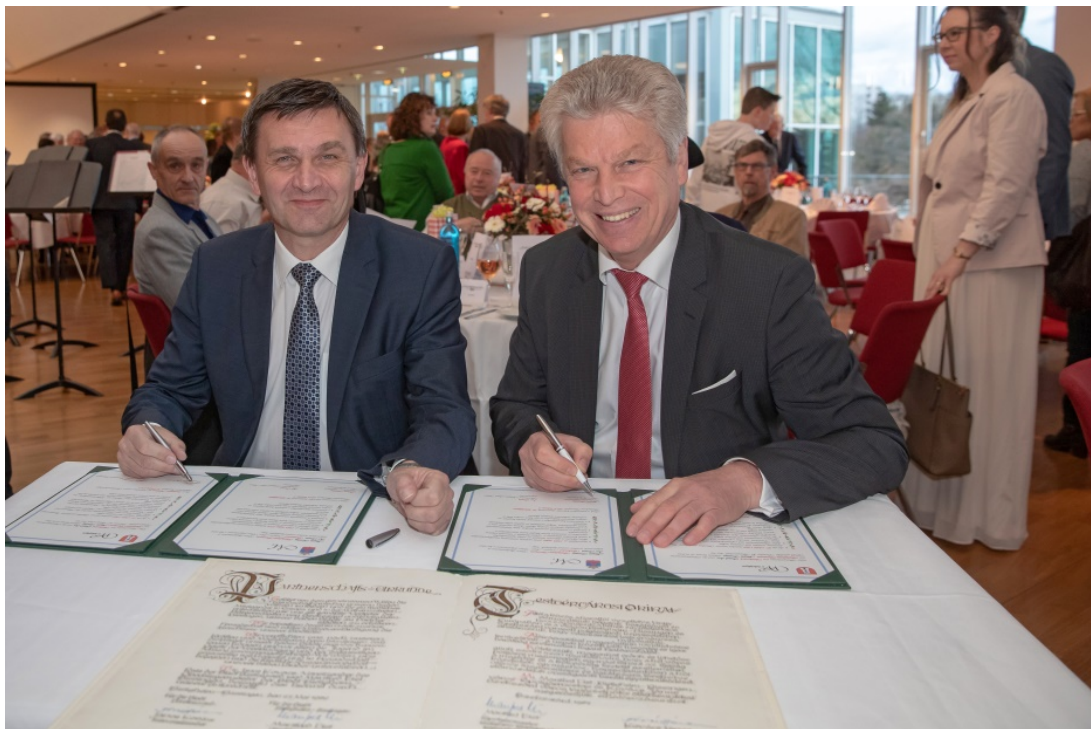
Foto: Jubiläum 30 Jahre Städtepartnerschaft zwischen Bietigheim-Bissingen und Szekszárd