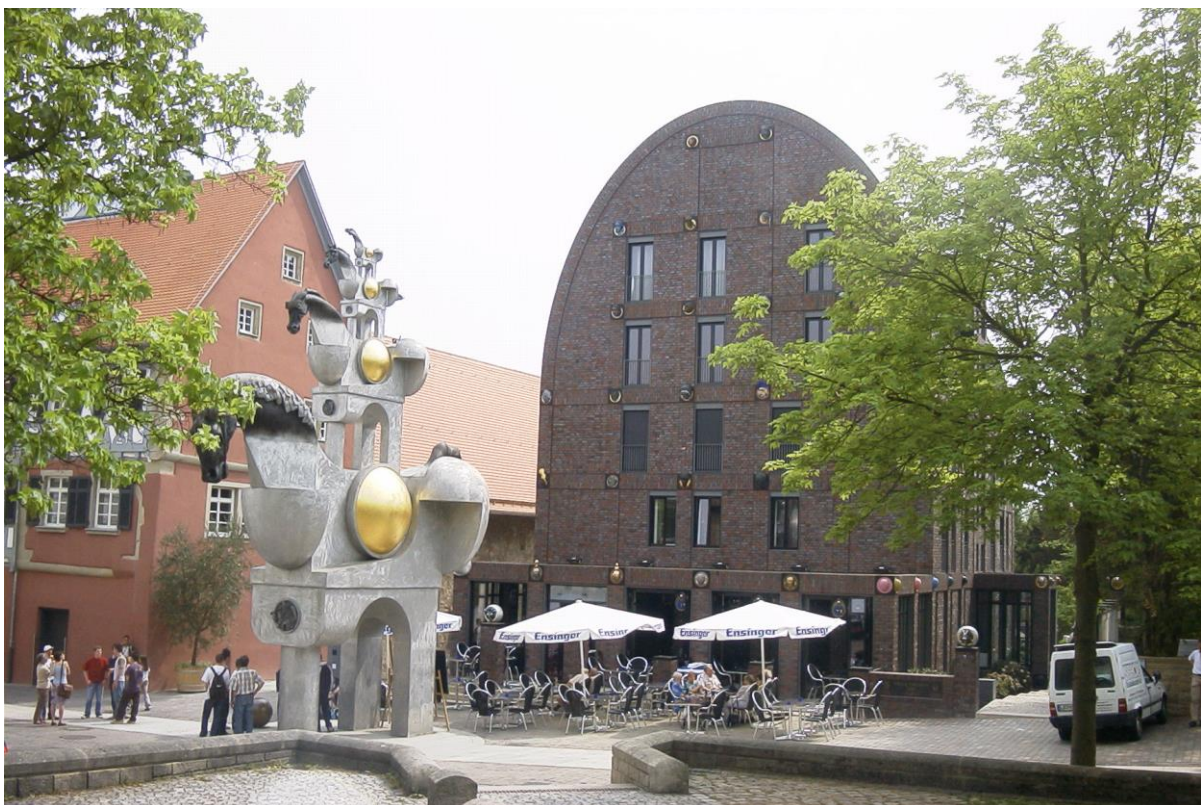
Hillerplatz – Villa Visconti mit dem Turm der Grauen Pferde