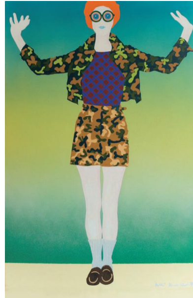
Ausstellung „Power up! Female Pop Art“

Seit dem Jahre 2006 findet alljährlich im „Hörsaal“ des Kronenzentrums die Bietigheimer Kinderuni statt. Mehrere Hundert Kinder kommen in drei Vorlesungen zusammen, um sich über die verschiedensten Themen zu informieren. In diesem Jahr standen folgende Vorlesungen auf dem Programm: „Micky Maus und Co. – Wie entsteht ein Trickfilm?“, „Warum fürchten wir uns im Dunkeln?“ und „Wo ist der Wind, wenn er nicht weht?“ Im Anschluss an die Vorträge durften die Kinder die Dozenten mit ihren vielen Fragen löchern.