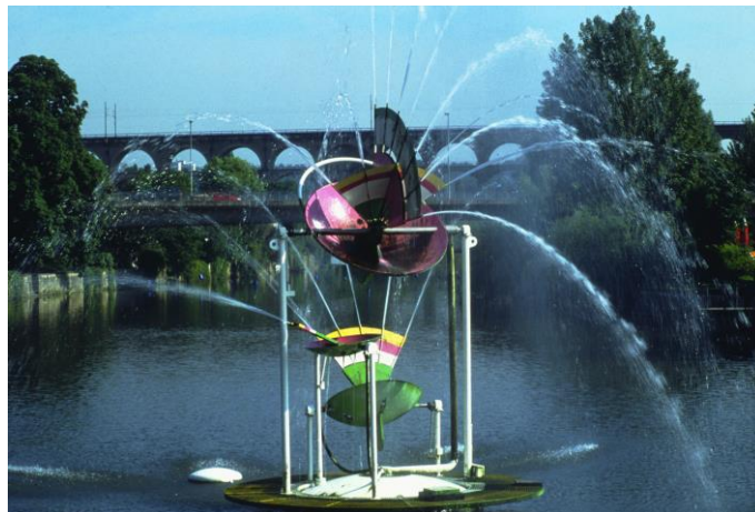
Enzblume mit Enzviadukt