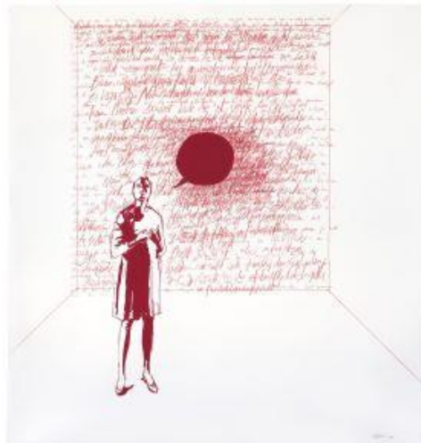
„Der Zeichnung Raum geben“, Städtische Galerie Bietigheim-Bissingen