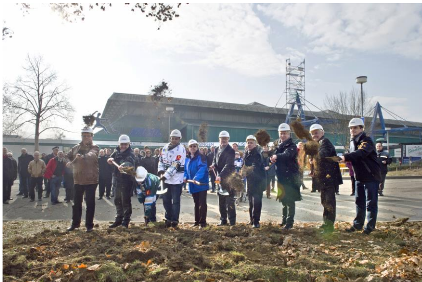
Spatenstich Eishalle

Nur sechs Monate nach dem Beschluss über die neue Eishalle rollten im Ellental die Bagger an und der offizielle Spatenstich zum Baubeginn der neuen Eishalle erfolgte. Nach fünf Jahren Diskussion und Abwägung verlief die Planung umso zügiger: die Stadtwerke als Bauherr sorgten mit ihrer Kompetenz in Energiefragen dafür, dass wir uns auf ein kostengünstiges Bauwerk freuen dürfen. Der erfahrene Architekt Schulitz aus Braunschweig steht für Qualität – wir alle hoffen, dass wir in etwa einem Jahr eine schöne, neue Halle neben der bisherigen Arena eröffnen können.