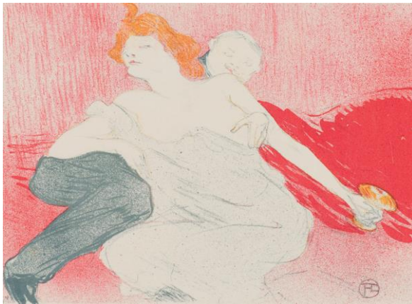
Grafik aus der Ausstellung

Mehr als 50 Mannschaften waren beim diesjährigen 24. Canadierrennen des Kanu-Clubs Bietigheim am Start. Die Teilnehmer traten in den unterschiedlichsten Kategorien an: so gab es unter anderem Wettbewerbe für Feuerwehren, für Senioren, für Jugendliche, für Frauen, gemischte Teams und für die Profis. In diesem Jahr gab es eine Neuerung: erstmals präsentierte der Verein neben den bekannten Wettkämpfen ein K.o.-Rennen, das am Samstag ausgetragen wurde. Jeweils zwei Mannschaften fuhren in offenen Damen- und Herrenklassen auf einer 350-Meter-Strecke in einem Kopf-an-Kopf-Rennen gegeneinander. Die zahlreichen Besucher hatten ihre Gaudi - für das leibliche Wohl sorgte das Team des Kanu-Clubs.