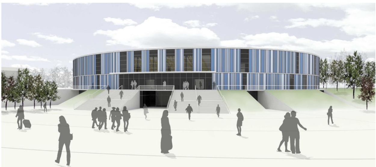
Eishalle – Fotomontage

Doch das sind nicht die letzten Baustellen, die es in unserer Stadt gibt. Der Gemeinderat hat sich in diesem Jahr entschlossen, für rund 18 Mio. Euro eine neue Eis- und Ballsporthalle im Ellental zu bauen. Die alte Eishalle war marode und für die zahlreichen Kinder und Jugendlichen, die gerne Eishockey spielen wollen, nicht mehr ausreichend. Auch die Profitruppe, die Steelers, die in der 2. Bundesliga erfolgreich mitmischen, können dort nicht mehr lange adäquaten Spitzensport bieten. Deshalb fiel der Beschluss nach langen Beratungen, die sich über mehrere Jahre hingezogen haben, letztlich fast einstimmig aus. Unter der Regie der Stadtwerke Bietigheim-Bissingen GmbH, die in Sachen Energieversorgung ihre besonderen Kompetenzen einbringen können, werden künftig Bäder und Eishallen in unserer Stadt betrieben. Eine Lösung, die den städtischen Haushalt schont und gleichzeitig den Neubau der Halle durch steuerliche Vorteile kostengünstig ermöglicht. Die neue Eishalle entsteht direkt neben der alten Eishalle im Ellental.