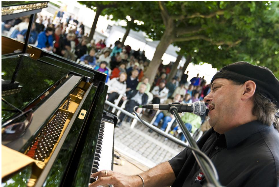
Best of Music-Festival

Nach zweijähriger Pause hieß es wieder: „Best is Back with Blues and Jazz“. Das Best of Music-Festival lockte an drei Tagen wieder tausende Musikfreunde aus nah und fern in unsere schöne Altstadt. Blues, Jazz, Boogie-Woogie und Rock´n´Roll sorgten trotz wechselhaftem Wetter für gute Laune – denn die treuen Best of Music-Fans freuten sich schließlich schon lange darauf. Nicht nur musikalisch, auch kulinarisch wurden die Gäste von den Gastronomen rund um den Marktplatz verwöhnt. Wir freuen uns bereits heute auf das nächste Best of Musical im Jahr 2013.