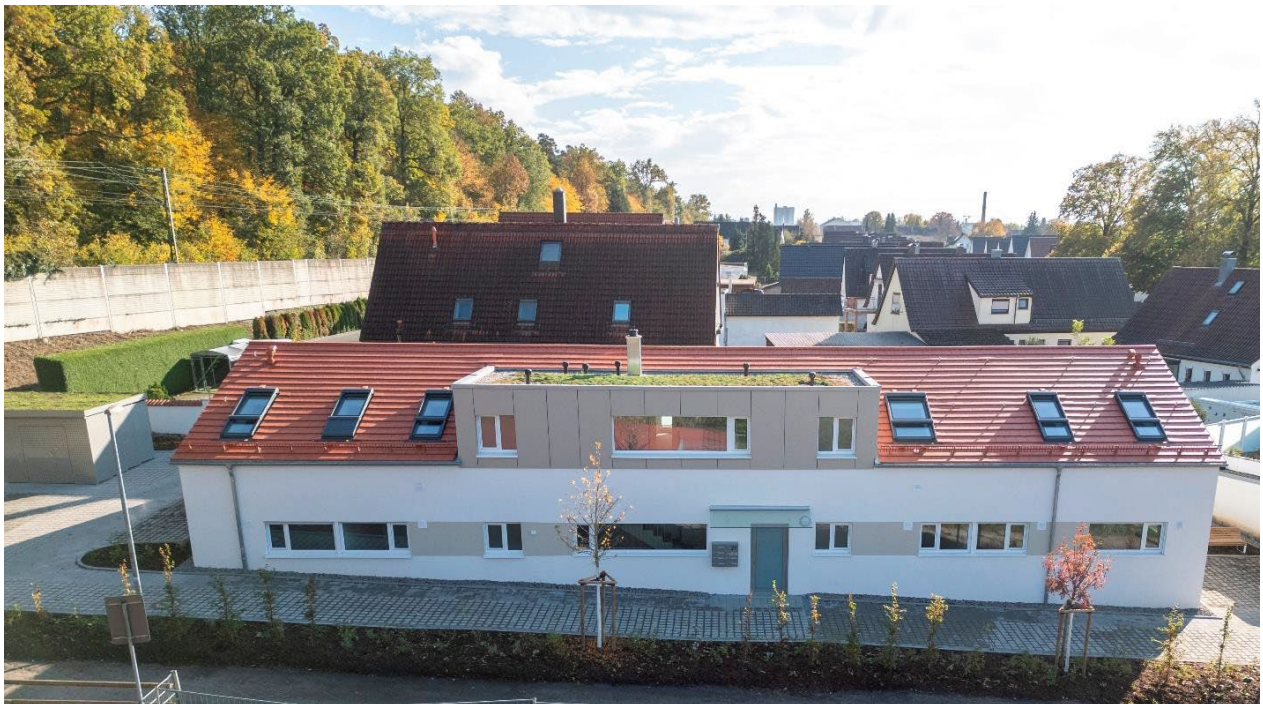
Mehrfamilienhaus der Bürgerstiftung Bietigheim-Bissingen im Finkenweg

Auch im Wohnungsbau ist der Abwärtstrend weiter spürbar. Über 2500 Wohnungen fehlen im Landkreis Ludwigsburg. Der Wohnungsmarkt ist für Mietsuchende sehr eng und teuer geworden. Für die Baufirmen und Bauträger wird es teilweise bedrohlich, da sie keine Aufträge erhalten und keine Gewinne mehr erzielen. Auch unsere Tochterfirma, die Bietigheimer Wohnbau GmbH, muss kämpfen. Neubauprojekte lohnen sich oft nicht mehr für Investoren. Die Baukosten sind sehr hoch, zugleich die Zinsen für Baukredite teuer. Unser Wohnungsbauunternehmen hat glücklicherweise in der Verwaltung von Wohnungen ein stabiles Standbein, sodass sie die schwierigen Jahre hoffentlich überstehen. Zugleich bauen wir zumindest im Bereich des Sozialen Wohnungsbaus mit unserer Bürgerstiftung weiter. In diesem Jahr konnten wir ein Gebäude im Stadtteil Sand mit 6 Wohnungen fertigstellen und zu günstigen Mieten an Familien vergeben, die schon sehr lange auf passenden Wohnraum warten. Wir wollen diesen Bereich des Wohnungsbaus auch im nächsten Jahr fortsetzen. Dank Zuschüssen des Landes können wir zumindest ohne Verluste bauen und vermieten.