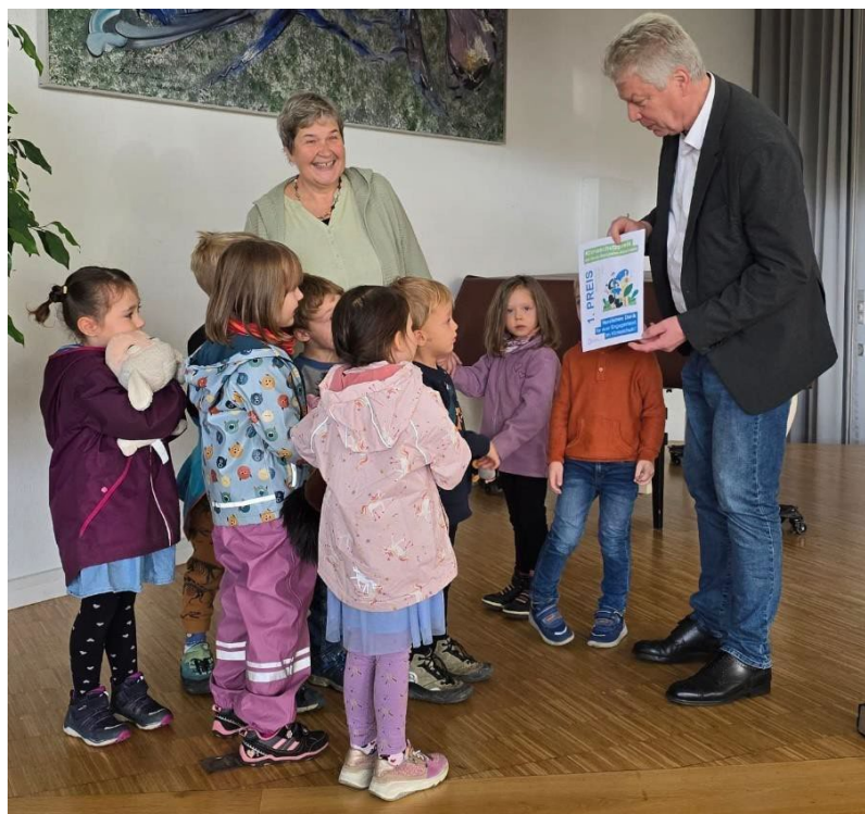
Vergabe Klimaschutzpreis an die Natur-Kita im Buch

Zum ersten Mal wurde der Klimaschutzpreis an besonders engagierte Mitmenschen für ihren bereits geleisteten Beitrag zum Klimaschutz verliehen. Im Rahmen des Solartags überreichte ich die Klimaschutzpreise an sieben Personen und Gruppen: den ersten Platz belegte die Natur-Kita im Buch, zweiter wurde die Nachhaltigkeits-AG der Ellentalgymnasien, der dritte Platz ging an das Berufliche Schulzentrum Bietigheim-Bissingen und vierter wurde der Förderverein der Grundschule im Buch. Auch die Schiller-, Sand- und Gustav-Schönleber-Schule wurden für ihre Beteiligung am Malwettbewerb zum Thema Solarenergie ausgezeichnet. Wichtig ist uns vor allem, die Jugend schon früh für den Klima- und Naturschutz zu begeistern.