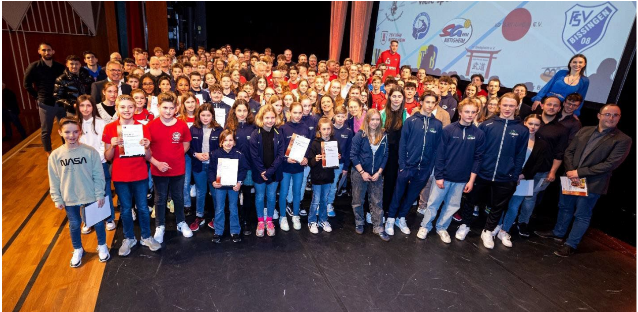
Sportlerehrung, Foto: Stadt Bietigheim-Bissingen, Fotograf Wolfgang Grünewald

Jahres“ durfte ich die Damen-Handballmannschaft der SG BBM ehren. Insgesamt 227 Sportlerinnen und Sportler sowie Funktionäre durften sich über eine Urkunde freuen.