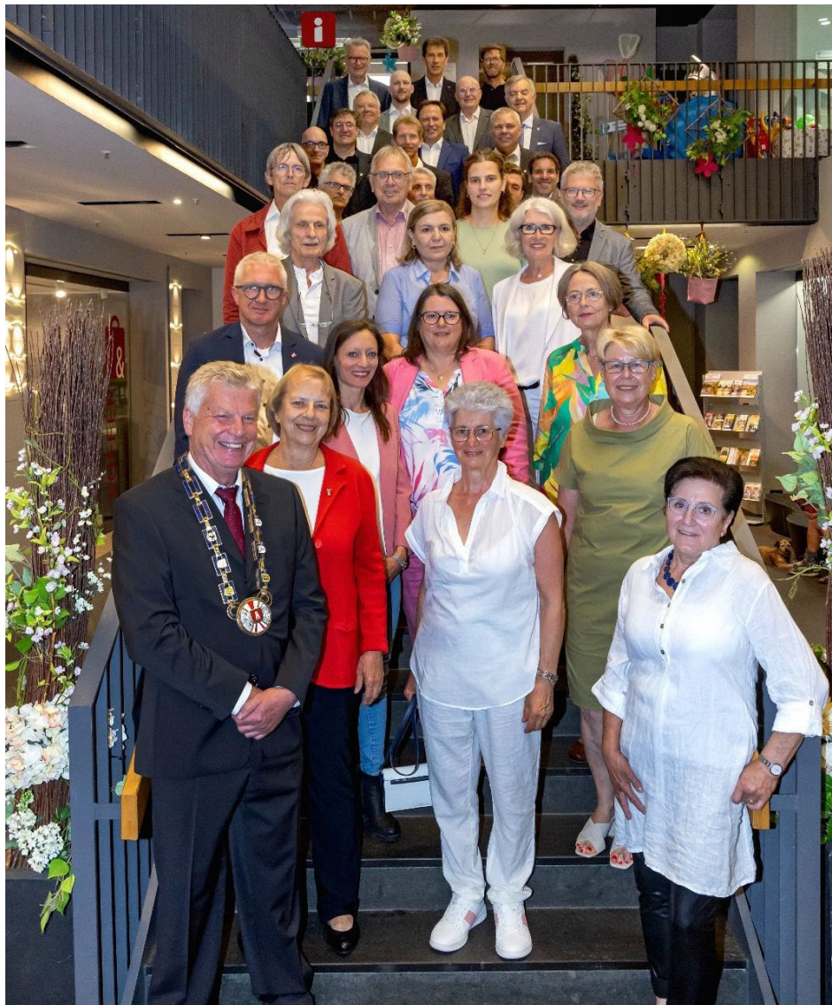
Neuer Gemeinderat 2024