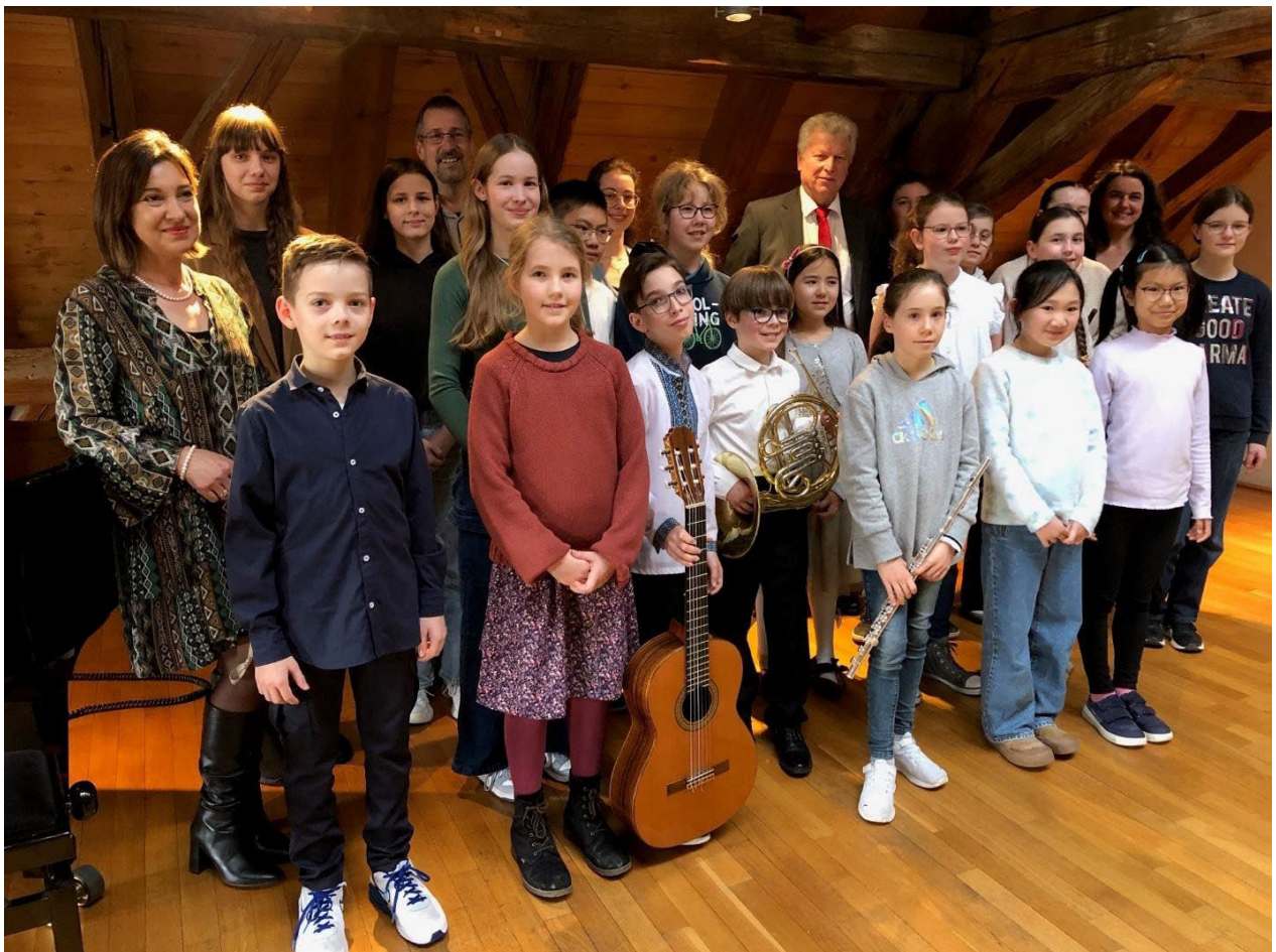
Empfang Jugend musiziert, Foto: Stadt Bietigheim-Bissingen

Ich durfte wieder unsere Nachwuchstalente der Städtischen Musikschule für ihre tollen Leistungen beim Wettbewerb „Jugend musiziert“ ehren. Beim Regionalwettbewerb in Ditzingen erzielten 16 Schülerinnen und Schüler einen ersten Preis, zwei Schülerinnen und Schüler durften sich über einen zweiten Preis freuen. Einen ersten Preis mit Weiterleitung zum Landeswettbewerb in Offenburg erzielten zwölf Schülerinnen und Schüler, davon durften sich vier über eine Weiterleitung zum Bundeswettbewerb freuen. Eine tolle Leistung!