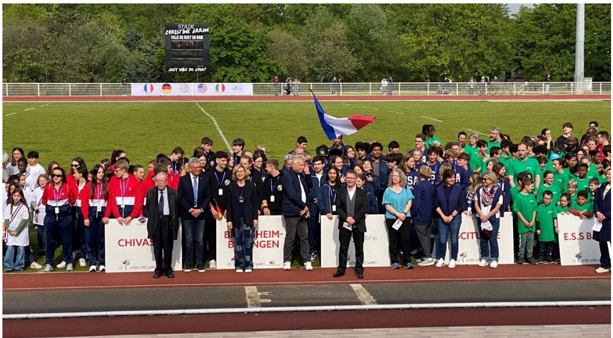
Sister Cities Games in Sucy-en-Brie

In unserer französischen Partnerstadt Sucy-en-Brie fanden anlässlich der Olympischen Spiele in Paris die „Sister Cities Games“ statt. Ein 15-köpfiges Team der Ellentalgymnasien trat gegen Teams aus Sucy-en-Brie, Chivasso/Italien und Scituate/USA in Volleyball, Basketball, Tischtennis und Leichtathletik an und holte sich in der Gesamtwertung den zweiten Platz.