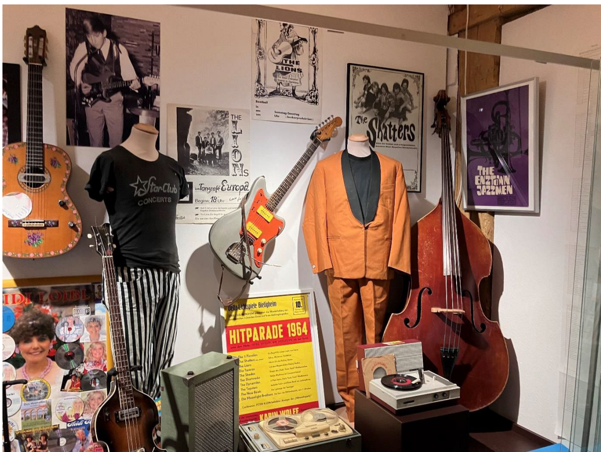
Ausstellung Bi-Bi Pop