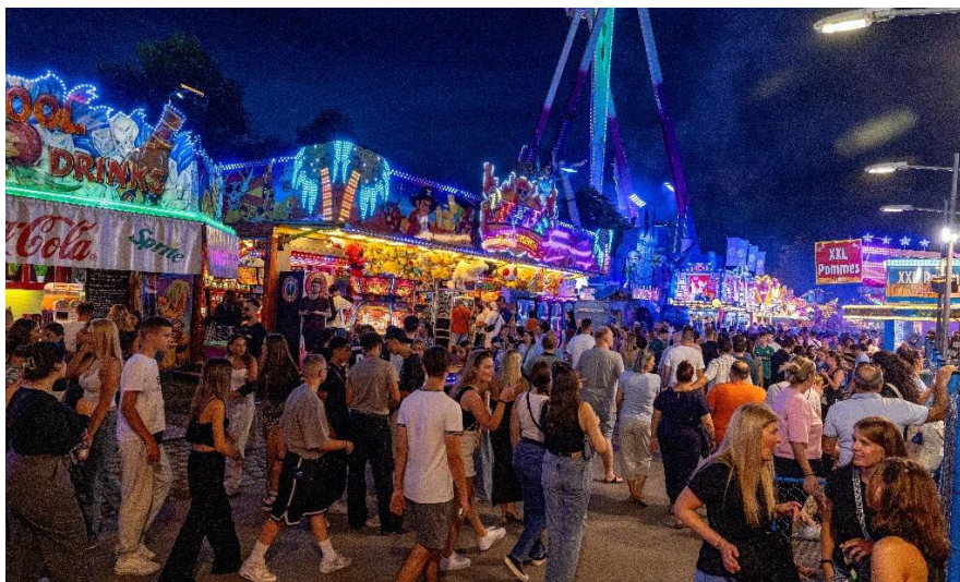
Bietigheimer Pferdemarkt