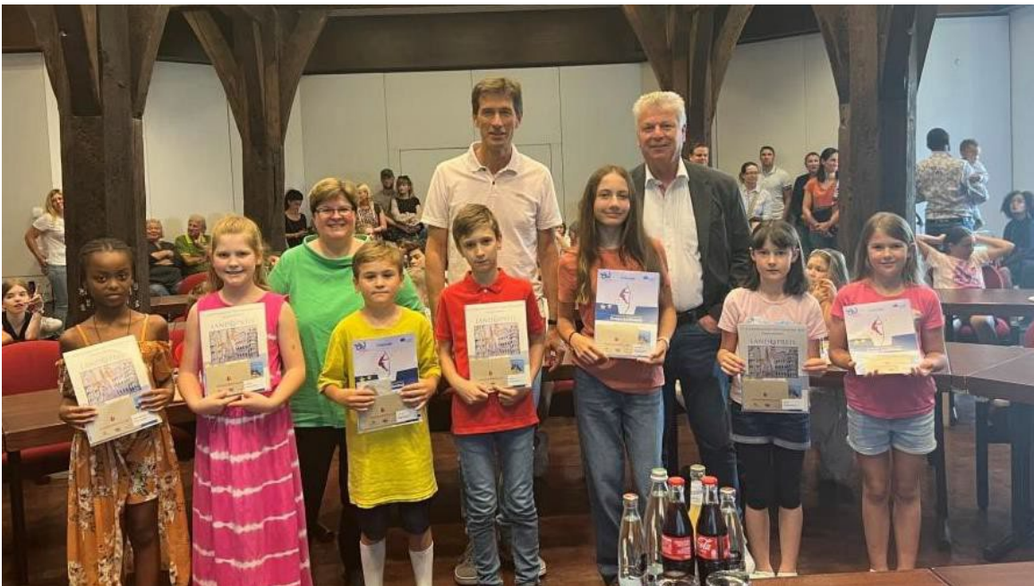
Europäischer Schülerwettbewerb, Foto: Stadt Bietigheim-Bissingen

Aber auch der Kunstunterricht wird an unseren Schulen hoch angesehen. Schon die jüngsten nehmen immer wieder an Wettbewerben teil Und ich freute mich, wieder einmal die Grundschülerinnen und Grundschüler von Schiller- und Waldschule für ihre Werke im Europäischen Schülerwettbewerb auszeichnen zu dürfen. Unter dem Titel „Europa (un-)limited“ zeichneten die Jungen und Mädchen, wie sie sich ein grenzenloses Europa vorstellen. Bundes-, Landes- und Ortspreise waren der Lohn ihrer Mühen.