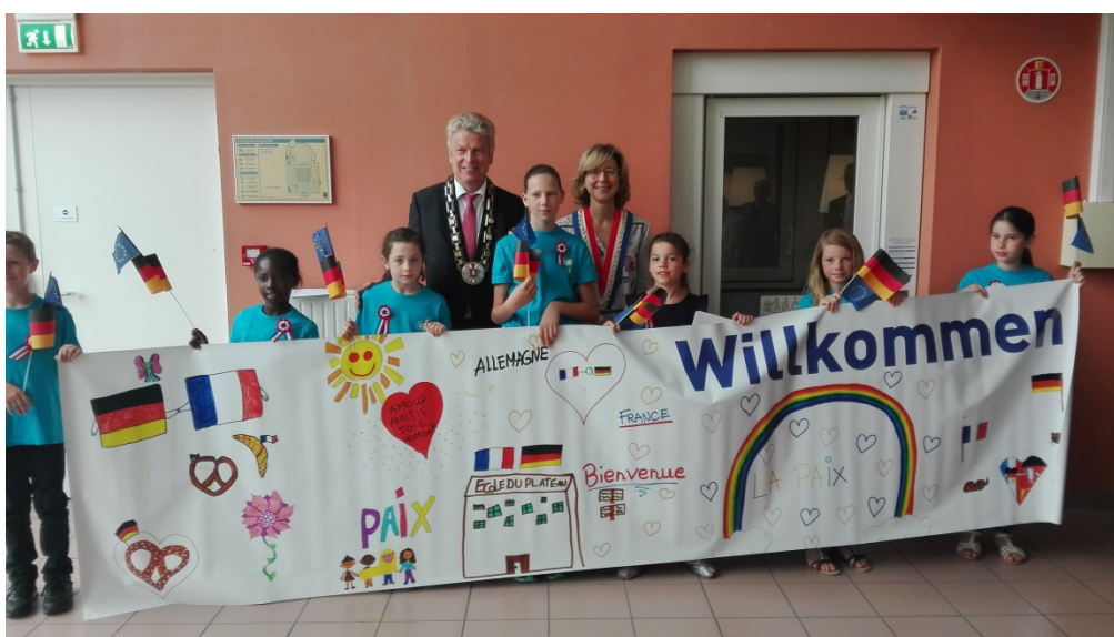
Bild: Partnerschaftsreise nach Sucy-en-Brie