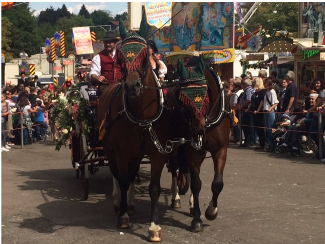
Bild: Pferdemarkt 2017

Bei gutem Wetter erlebten wir wieder fünf tolle Festtage beim 83. Bietigheimer Pferdemarkt. Die unvergleichliche Mischung aus herausragendem Turniersport, Vergnügungspark, Festzelt, Krämermarkt, Autoausstellung und landwirtschaftlicher Ausstellung lockte unzählige Besucherinnen und Besucher in unsere schöne Stadt. Besonderes Highlight war wie gewohnt der beliebte Festumzug am Montag – fast 60 Gruppen mit über 500 Teilnehmern begeisterten rund 20.000 Besucherinnen und Besucher aus der Umgebung entlang der Festzugsstrecke.