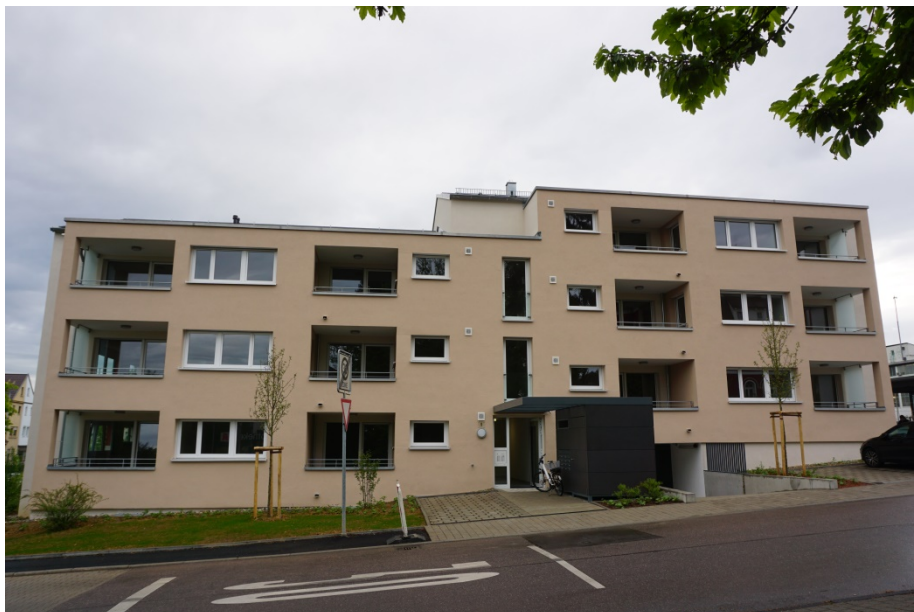
Bild: Gebäude mit bezahlbarem Wohnraum, Mörikestr. 1

Das zweite Gebäude mit bezahlbarem Wohnraum wurde fertig: in der Mörikestr. 1 sind 12 Wohnungen entstanden, die uns helfen, die Wohnungssuche von Menschen mit geringem Einkommen zu lindern. Unsere Bürgerstiftung ist seit einigen Jahren auf diesem Feld aktiv und wird weitere Gebäude bauen. Ein Beitrag zur Linderung der Wohnungssituation.