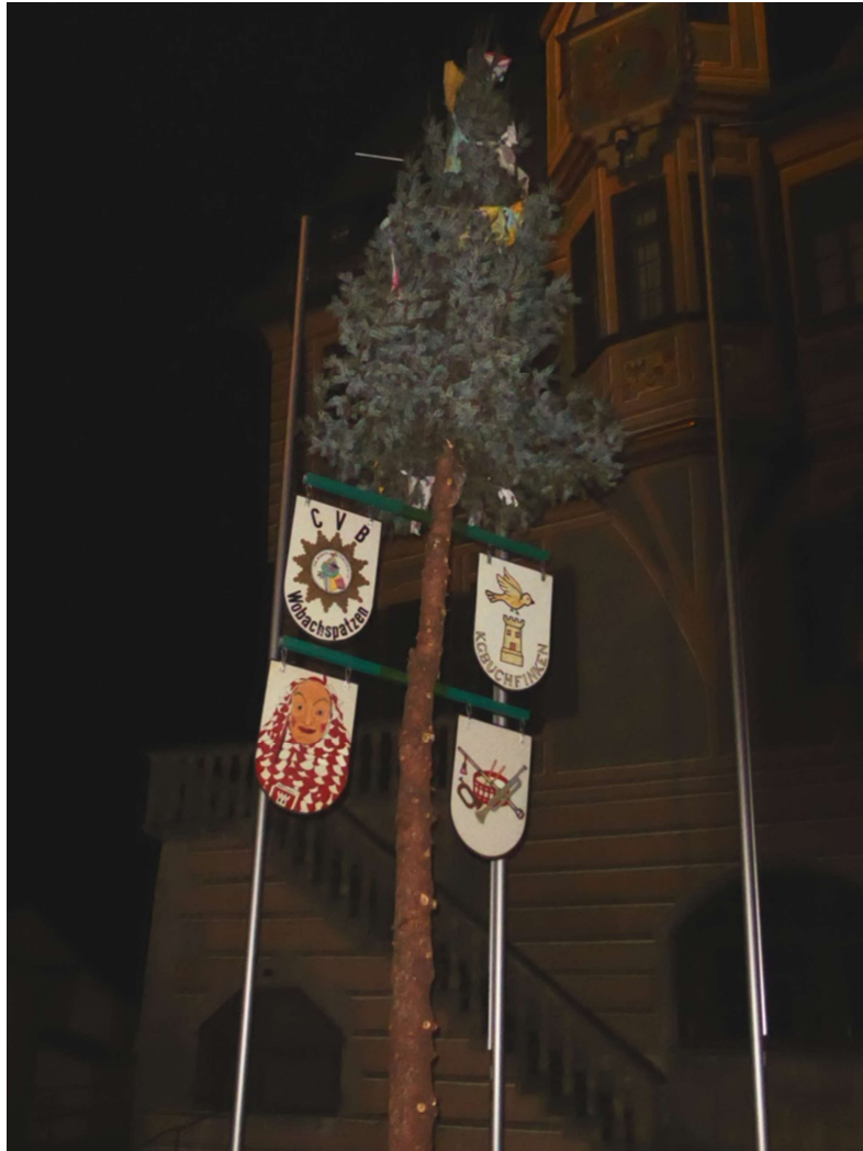
Bild: Rathaussturm 2017

ordentlich feierten. Aber auch die Bietigheimer Wobachspatzen ließen es sich nicht nehmen und feierten mit ihren befreundeten Guggenmusikern und Brauchtumsgruppen bei der Narrenparty in der Aurainhalle.