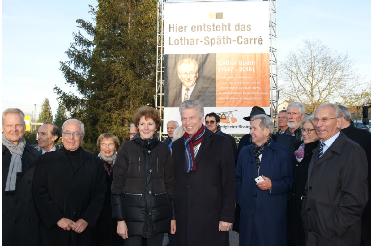
Bild: Feierstunde Lothar-Späth-Carré