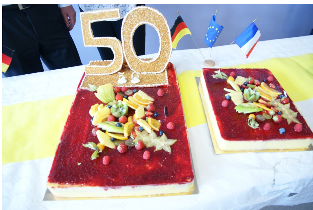
Bilder: Partnerschaftsreise nach Sucy-en-Brie