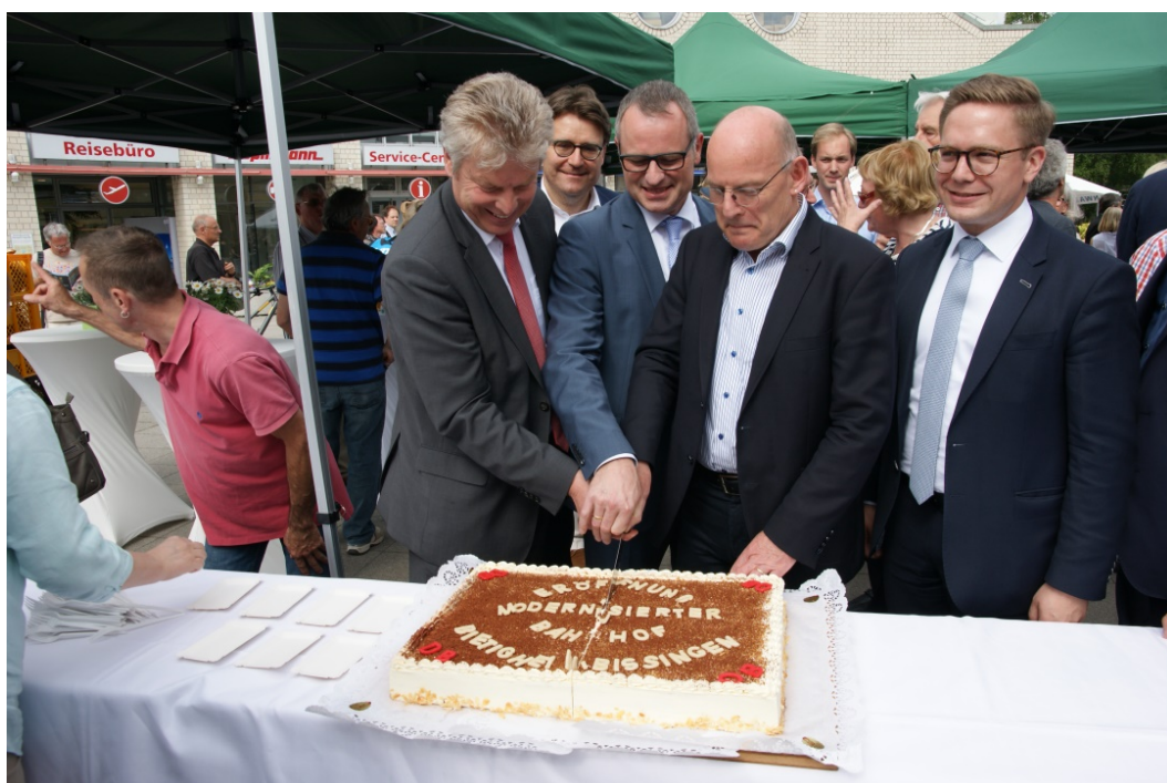
Bild: Eröffnung modernisierter Bahnhof

Feierlich eröffneten wir den modernisierten Bahnhof Bietigheim-Bissingen. Zwei Jahre lang hat die Deutsche Bahn die Station im laufenden Betrieb modernisiert. Über 6 Millionen Euro investierten die Bahn, das Land und die Stadt in die Modernisierung. Zur Feier des Tages gab es auch eine Torte, die an die Besucherinnen und Besucher verteilt wurden. Seit Juli 2015 wurden drei Aufzüge eingebaut, zwei Bahnsteige neu gebaut und mit entsprechender Ausstattung versehen. Außerdem wurde die Bahnsteigunterführung aufgewertet. Zugleich erinnerten die Läden rund um den Bahnhofplatz an das Jubiläum 25 Jahre neuer Bahnhofsvorplatz Bietigheim-Bissingen.