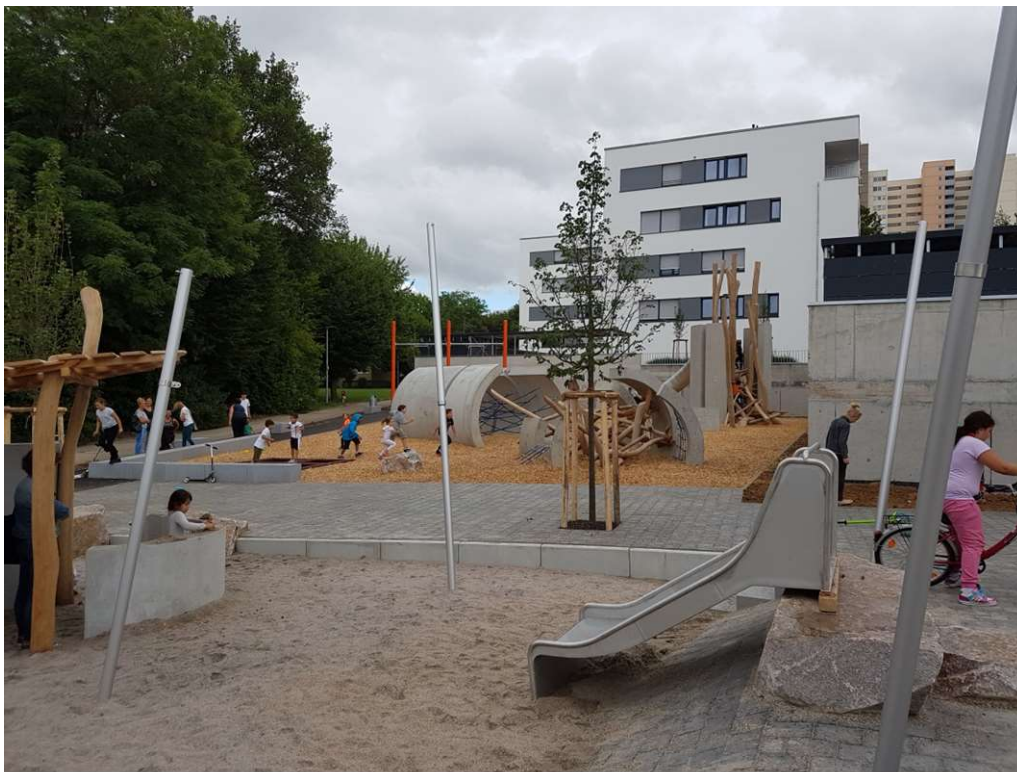
Bild: Eröffnung Spielplatz Paulusareal