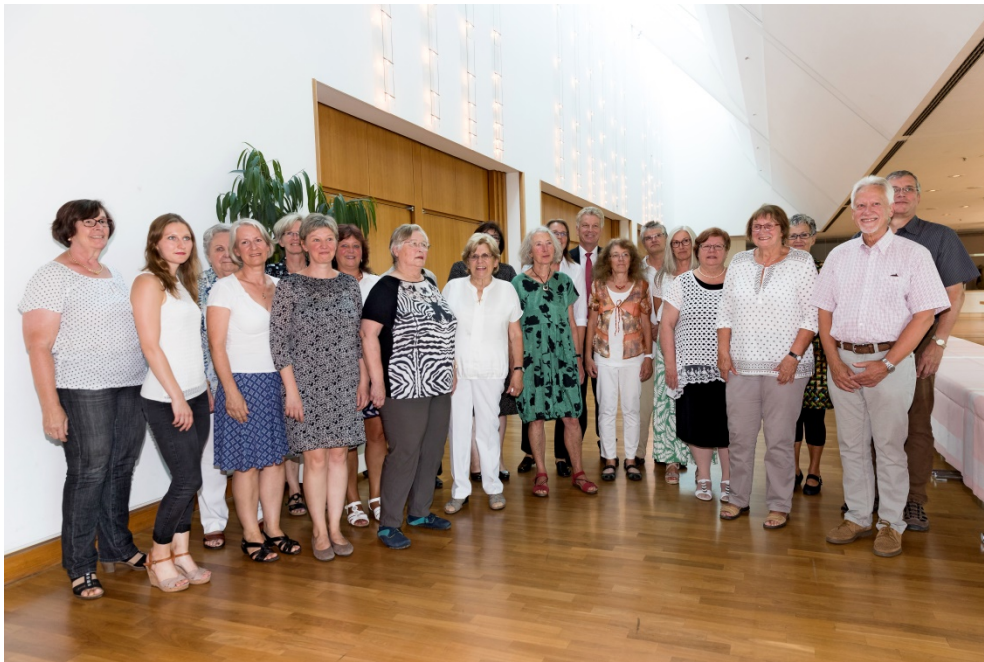
Bild: Soziale Ehrung 2017

In einer Feierstunde durfte ich 30 sozial engagierte Bürger aus Vereinen, Kirchen und Organisationen für ihr jahrelanges Engagement mit einer Gedenkmünze auszeichnen. Das Ehrenamt ist Ausdruck einer Gesellschaft, in der man nicht nur an sich selbst denkt, sondern seine Zeit und Arbeitsleistung kostenlos einbringt, um anderen zu helfen. Ihnen Respekt zu zeigen, war mir eine Ehre.