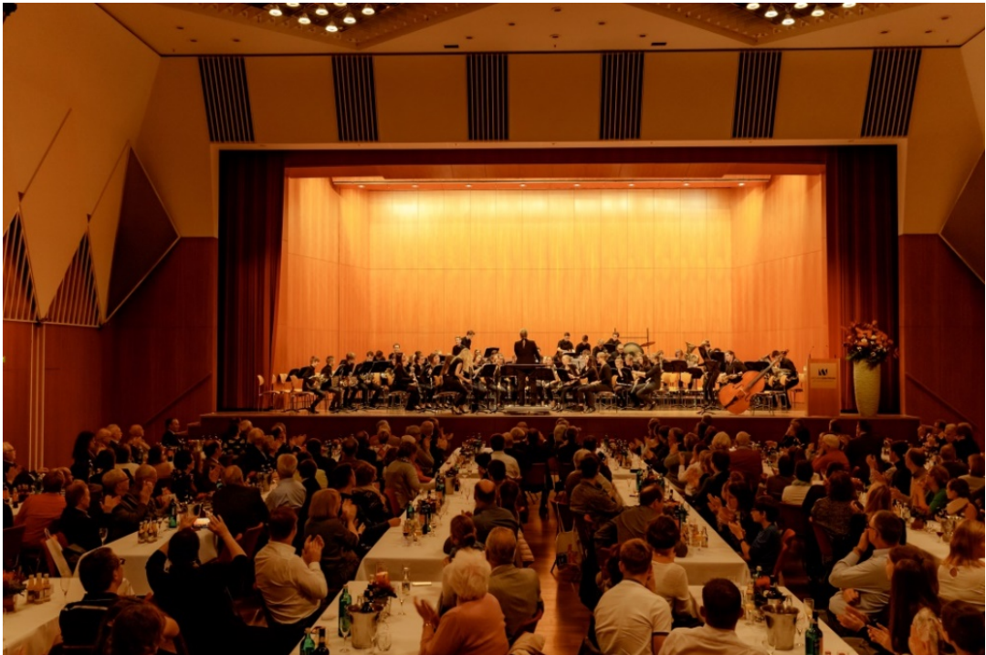
Bild: Jubiläumskonzert mit der Gemeinde Bietigheim/Baden