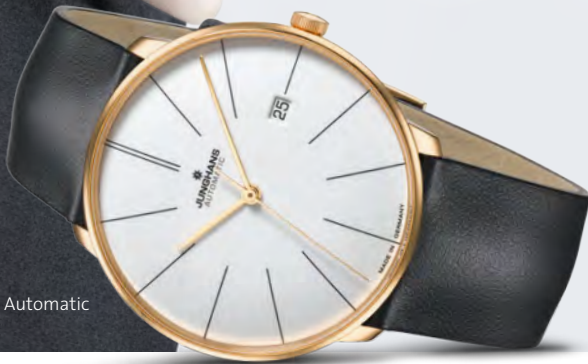
Meister fein Automatic 27/7150.00

Streng und modern gestaltet, steht die Meister fein Automatic für eine neue Geometrie in der Meister Linie. Die gewölbte Form von Gehäuse und Saphirglas rückt die souverän schlichte Zifferblattgestaltung in den Fokus des Betrachters. Meister fein Automatic: Automatikwerk, Sichtboden, wasserdicht bis 5 bar. www.junghans.de