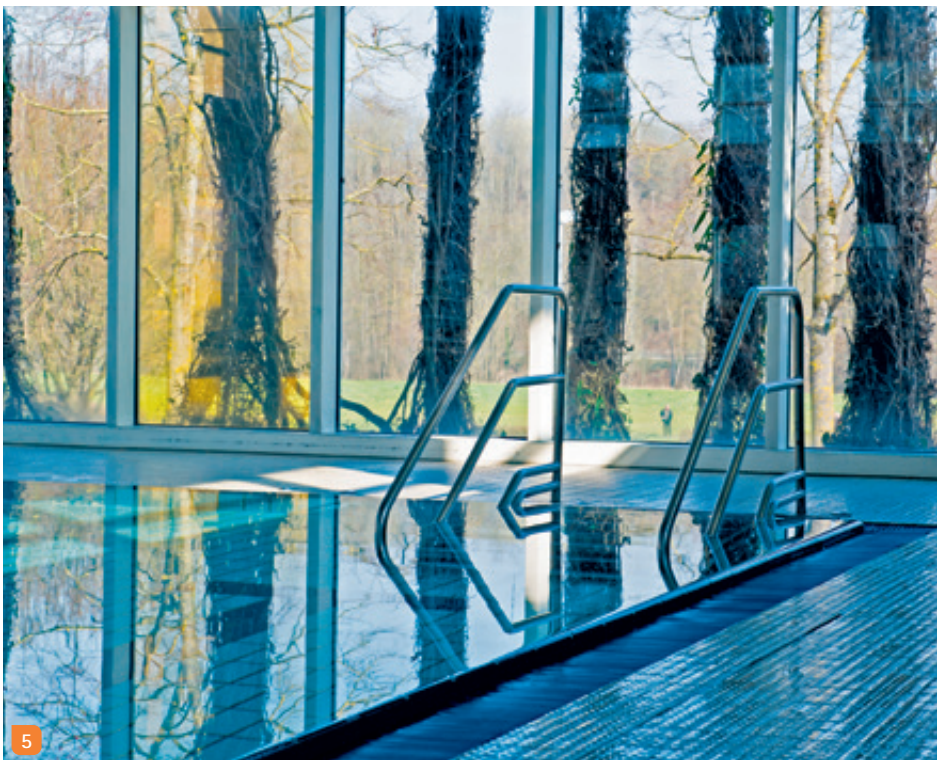
4 Höher, weiter, schneller: Schwimmsport in Bissingen 5 Sicher und komfortabel in den Badespaß eintauchen