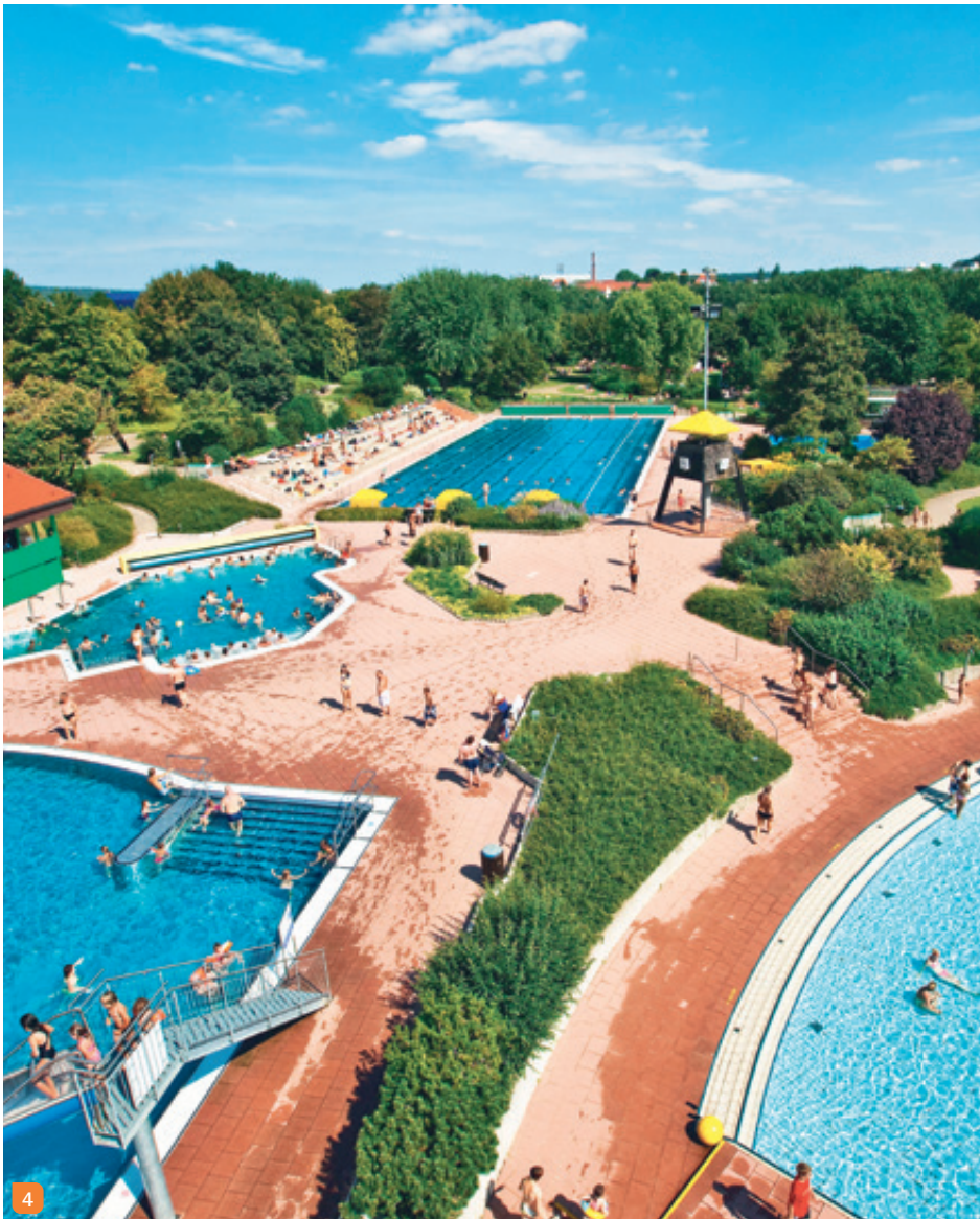
4 Nichtschwimmerbecken, Sportbecken, Wellenbad (unten rechts) und Sprungbecken (oben rechts) auf einen Blick

Badepark Ellental · Schwarzwaldstr. 41 74321 Bietigheim-Bissingen · Tel. 07142 7887 547