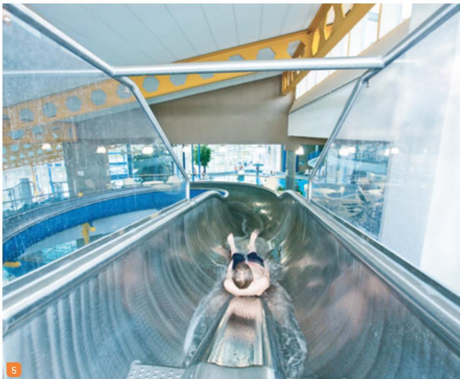
4 Fünfundzwanzig Meter Trainingsspaß im Sportbecken 5 Zweiundfünfzig Meter (Edelstahl-)Rutschvergnügen

Bad am Viadukt Holzgartenstr. 26 · 74321 Bietigheim-Bissingen Telefon 07142 7887 440