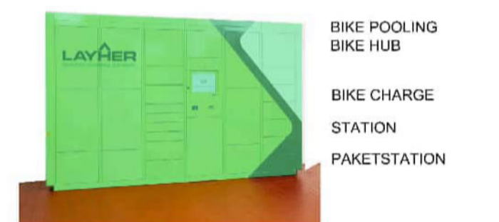
ENTWURF V7 (nur Flachdach)

Neubau Wohnquartier Eichenhof & Lindenhof mit Tiefgarage und Ärztehaus