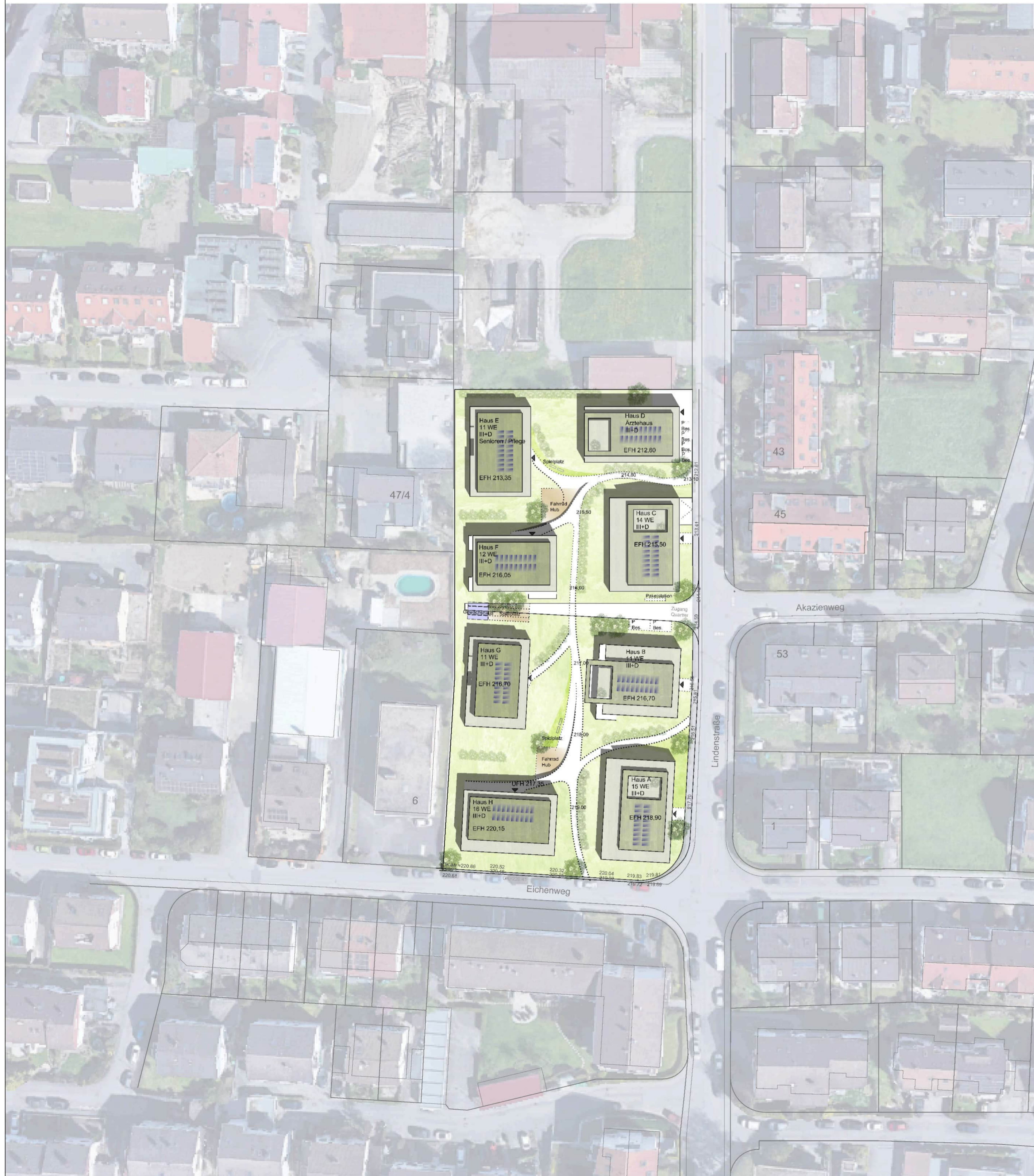
LAGEPLAN M 1/500