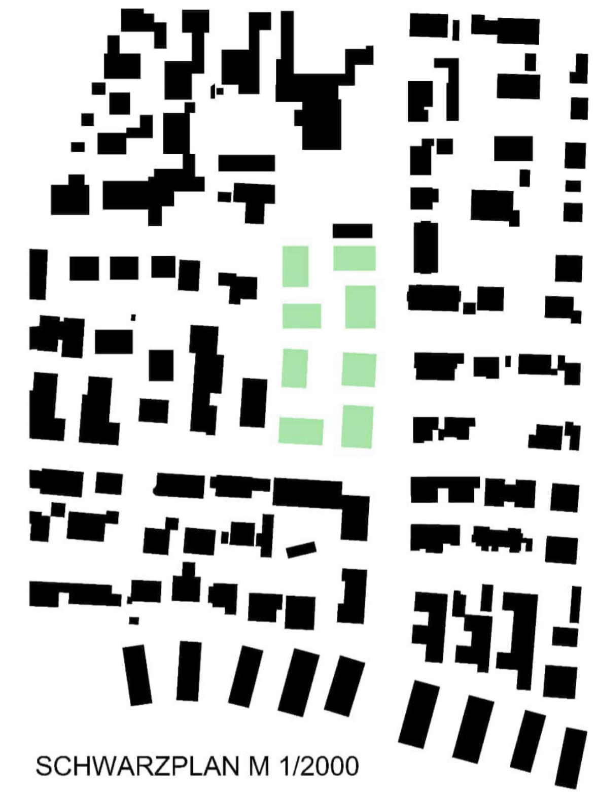
SCHWARZPLAN M 1/2000