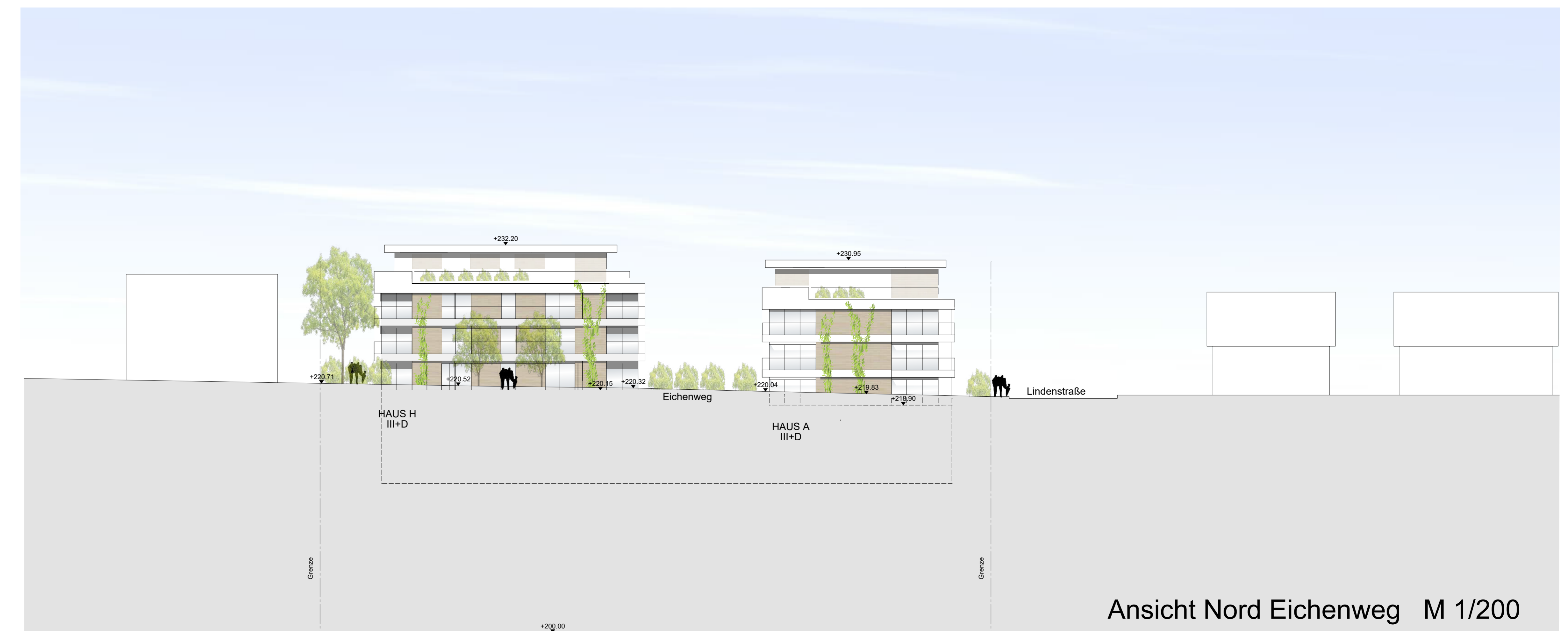
Ansicht Nord Eichenweg M 1/200

Die Wohnanlage im Nordhang und Aussicht zur Enz und Ruine orientiert sich nach Süden und Westen, ausgerichtet zur Sonne mit großzügigen Fassadenöffnungen und attraktiven Rücksprünge. Nutzung solarer Ressourcen in der Dachfläche.